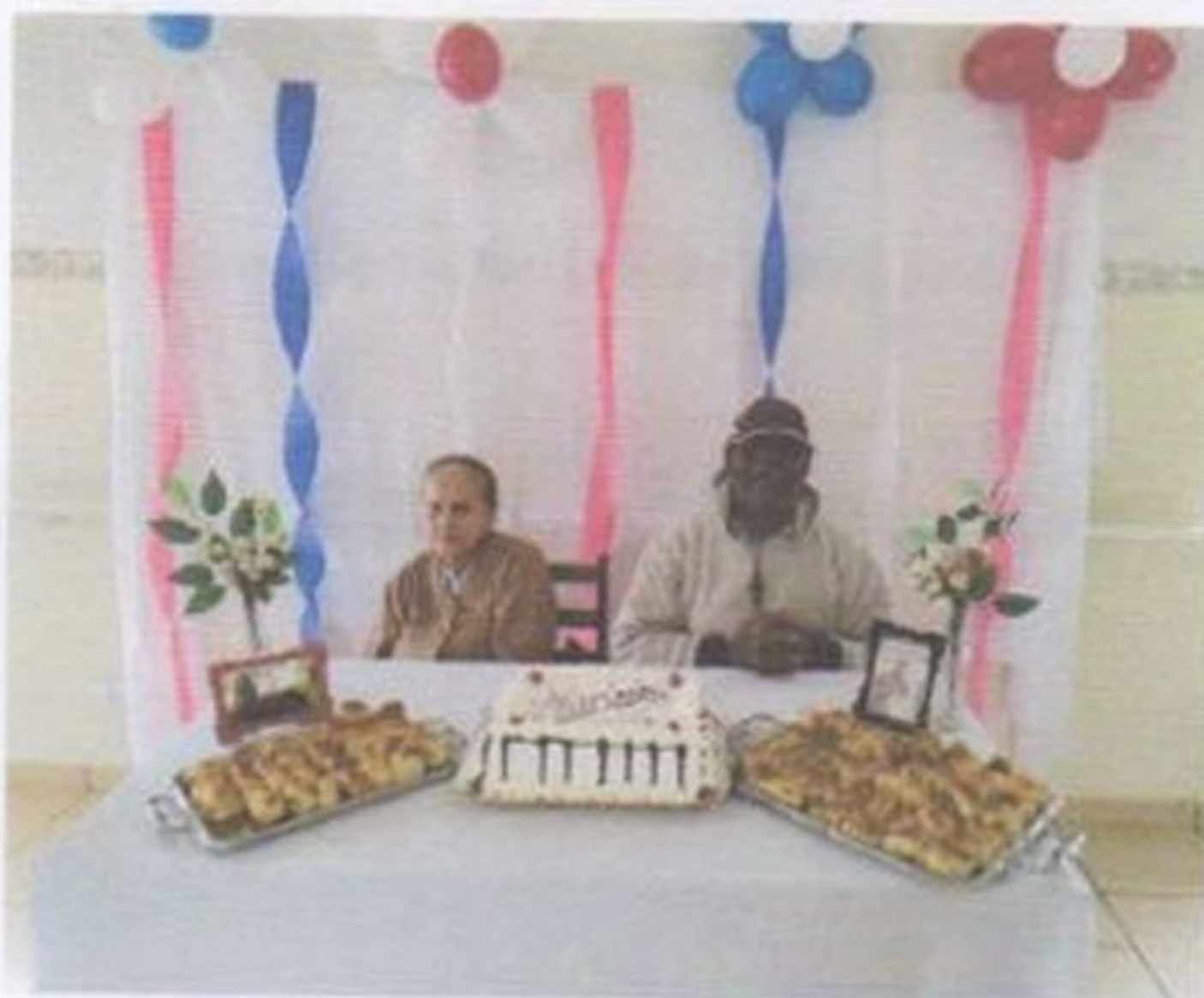
Comemoração dos aniversariantes do mês

11 Segue fotos de algumas atividades realizadas com idosos durante o ano de 2022.