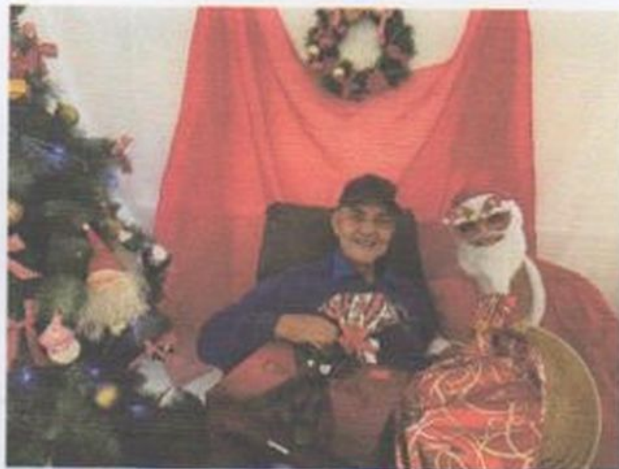
Entrega dos Presentes “ Cartinhas de Natal”

CEBAS nº 71000.070949 – Lei de Utilidade Pública Municipal nº 578/81 de 11 de março de 1981. Utilidade Pública Estadual, Decreto nº 47.480 de 19/12/02 – CRCE 0659/2012