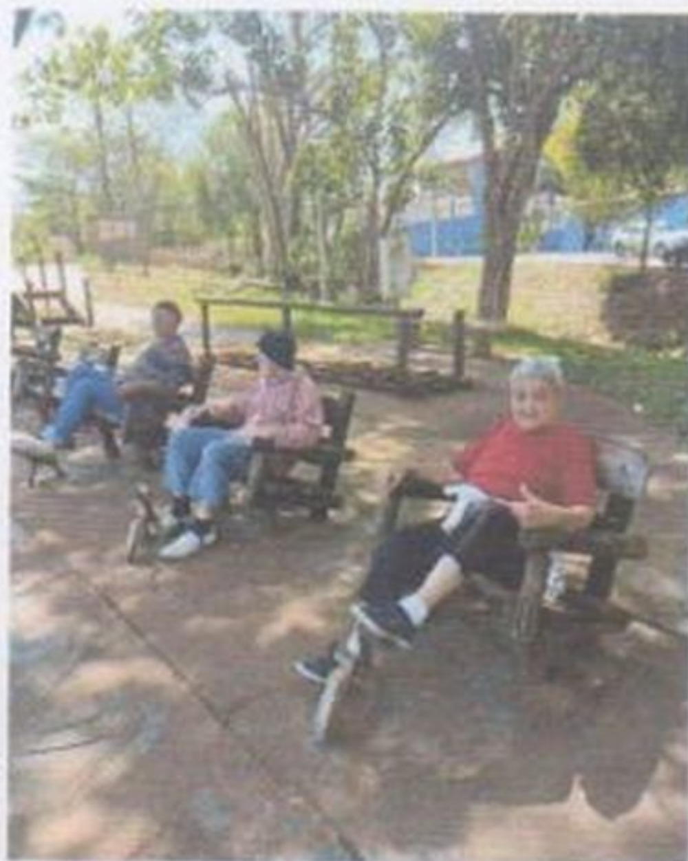
Caminhada ao ar livre

CEBAS nº 71000.070949 – Lei de Utilidade Pública Municipal nº 578/81 de 11 de março de 1981. Utilidade Pública Estadual, Decreto nº 47.480 de 19/12/02 – CRCE 0659/2012