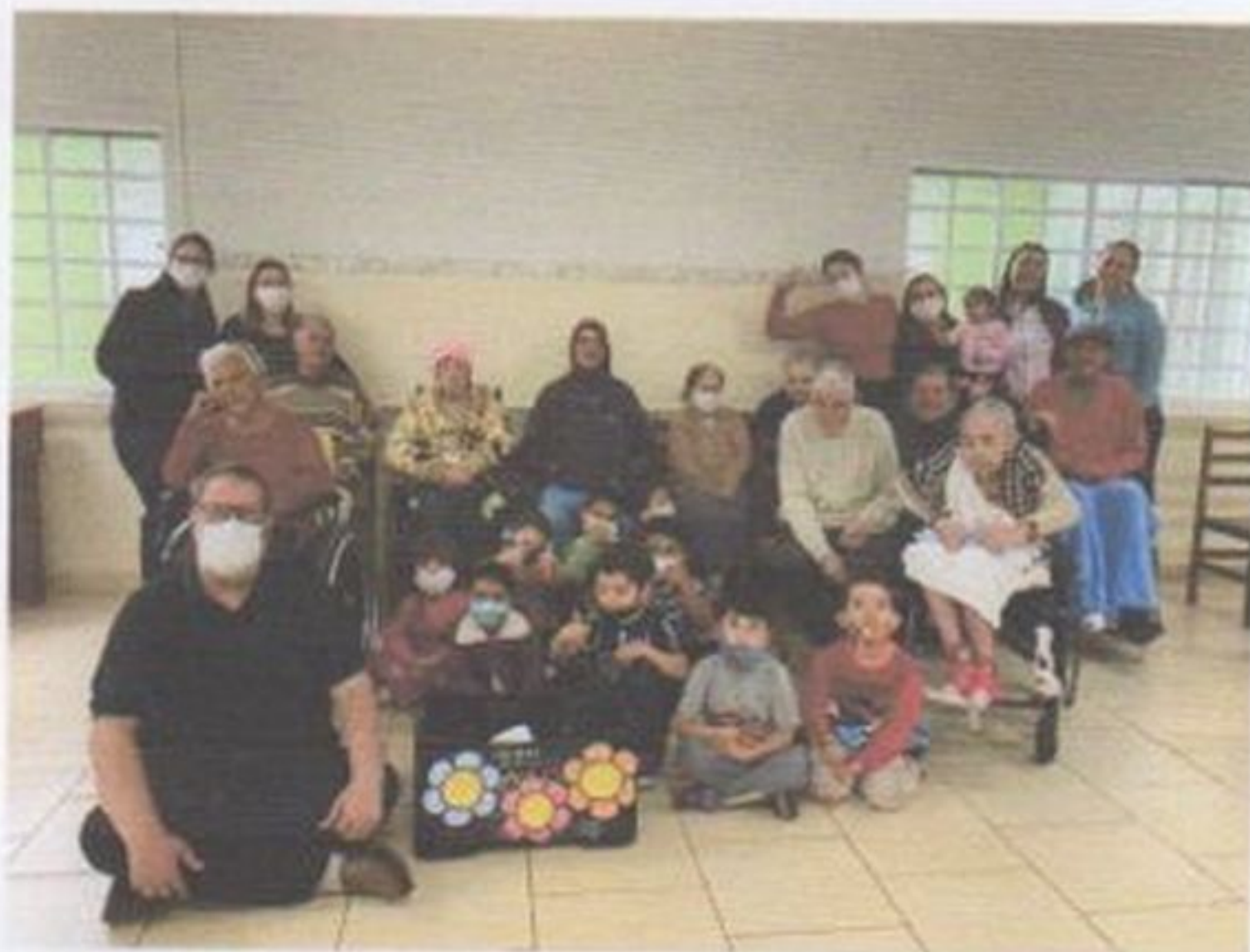
Visita de alunos e professores

CEBAS nº 71000.070949 – Lei de Utilidade Pública Municipal nº 578/81 de 11 de março de 1981. Utilidade Pública Estadual, Decreto nº 47.480 de 19/12/02 – CRCE 0659/2012