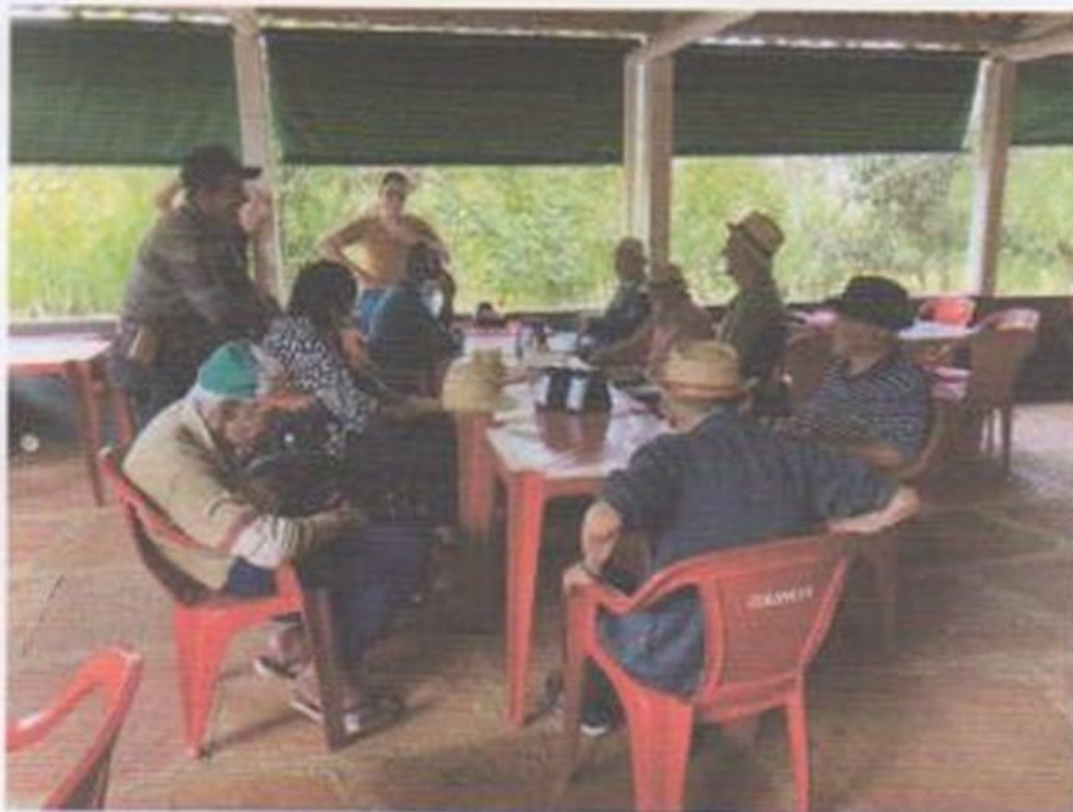
Passeio no pesqueiro

CEBAS nº 71000.070949 – Lei de Utilidade Pública Municipal nº 578/81 de 11 de março de 1981. Utilidade Pública Estadual, Decreto nº 47.480 de 19/12/02 – CRCE 0659/2012