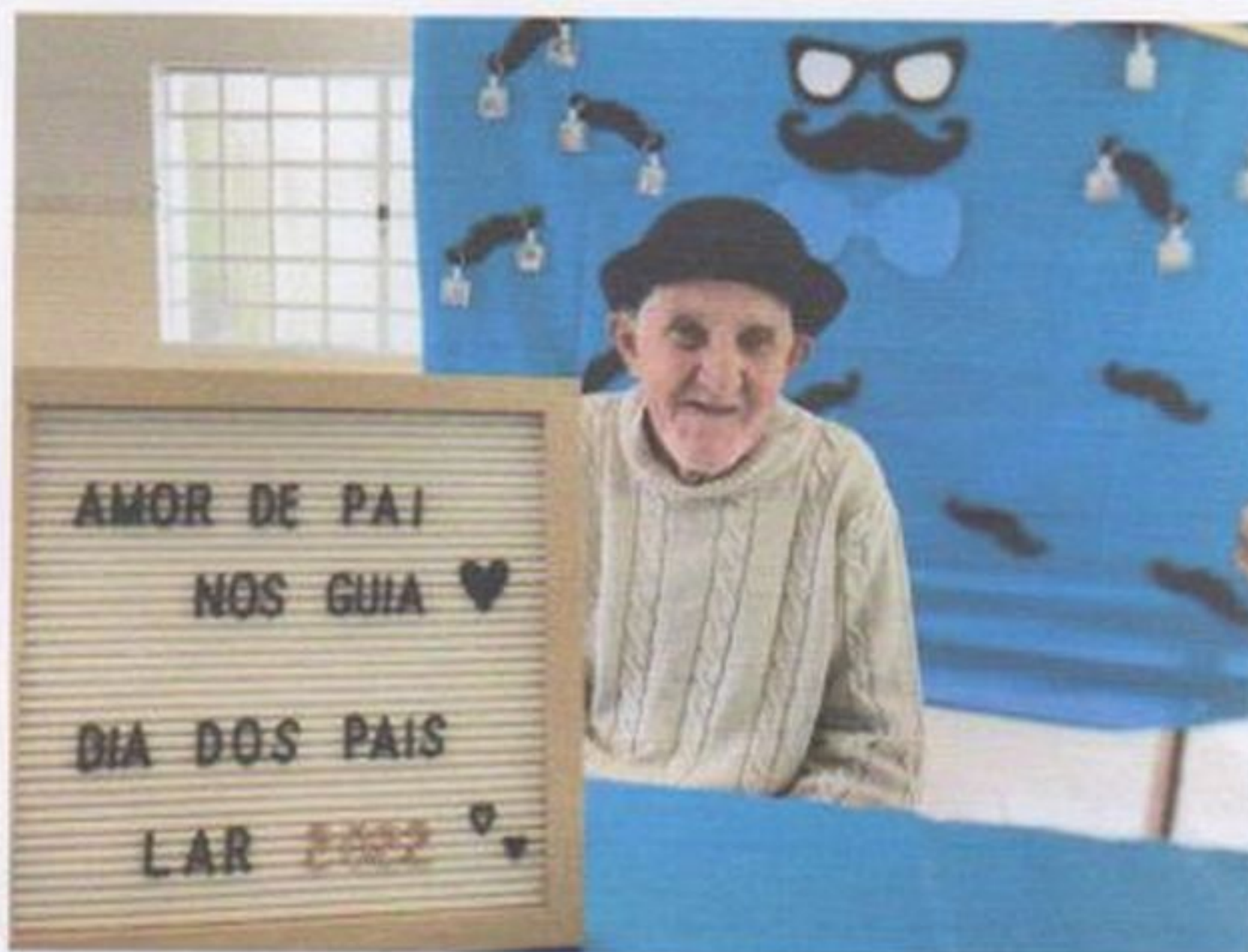
Comemoração dia dos pais

CEBAS nº 71000.070949 – Lei de Utilidade Pública Municipal nº 578/81 de 11 de março de 1981. Utilidade Pública Estadual, Decreto nº 47.480 de 19/12/02 – CRCE 0659/2012