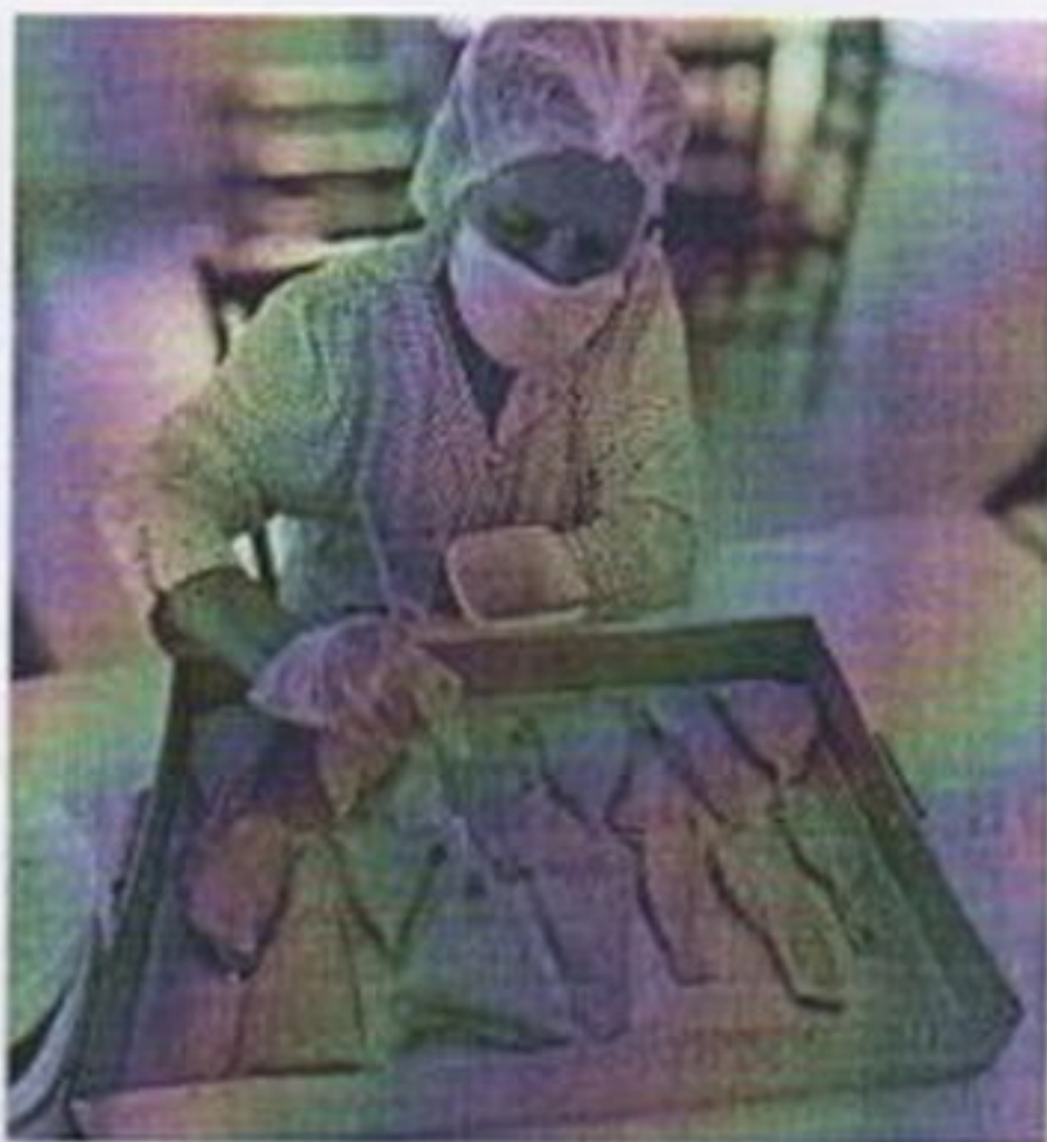
Atividade de culinária

CEBAS nº 71000.070949 – Lei de Utilidade Pública Municipal nº 578/81 de 11 de março de 1981. Utilidade Pública Estadual, Decreto nº 47.480 de 19/12/02 – CRCE 0659/2012