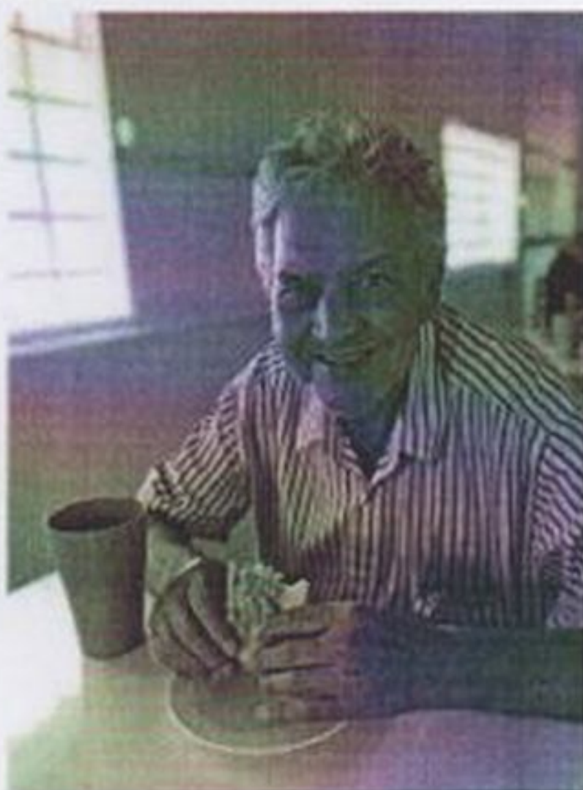
Pastel no café da tarde