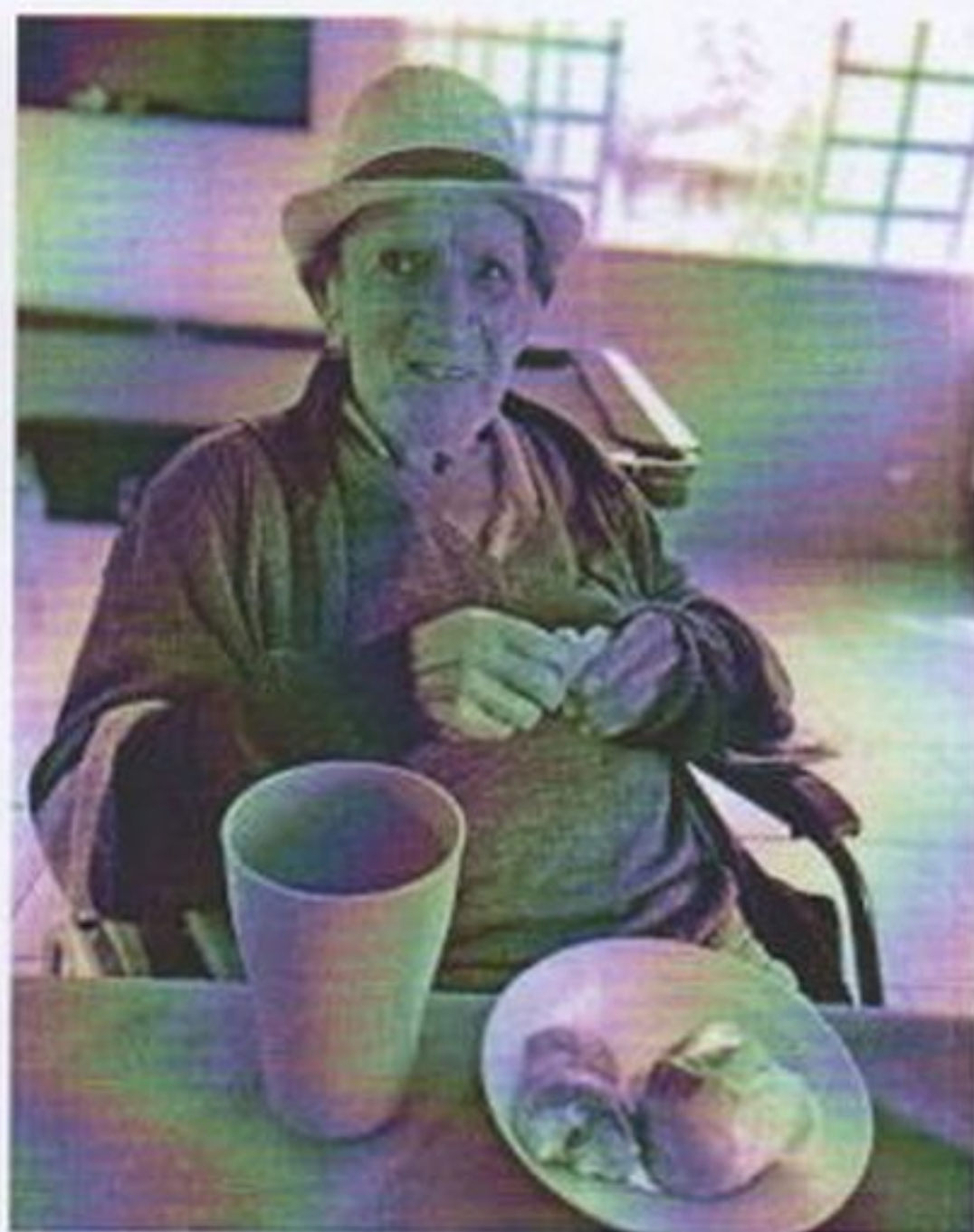
Café da tarde com salgados e refrigerante