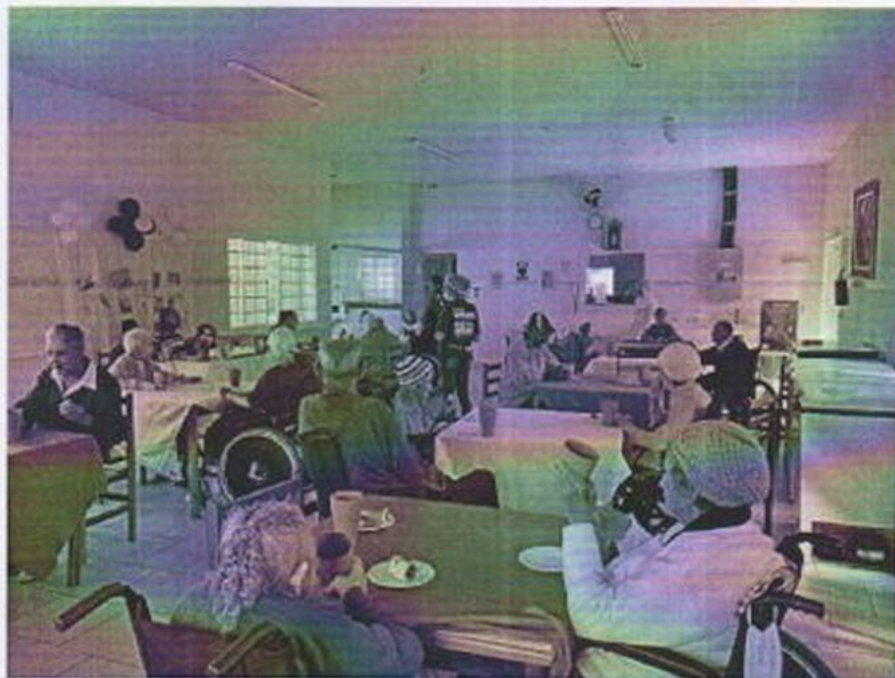
Idosos participando do café da tarde em comemoração aos aniversariantes