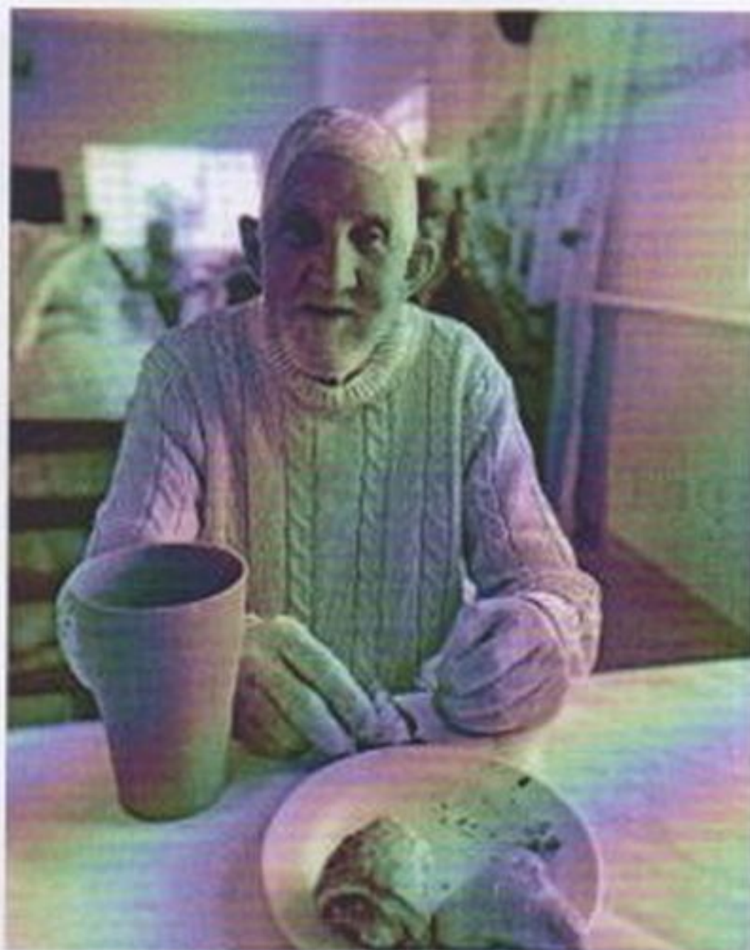
Café da tare com salgados