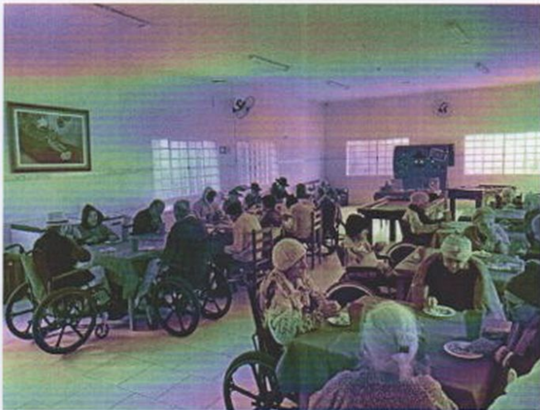
Idosos tomando café da tarde

CEBAS nº 71000.070949 – Lei de Utilidade Pública Municipal nº 578/81 de 11 de março de 1981. Utilidade Pública Estadual, Decreto nº 47.480 de 19/12/02 – CRCE 0659/2012