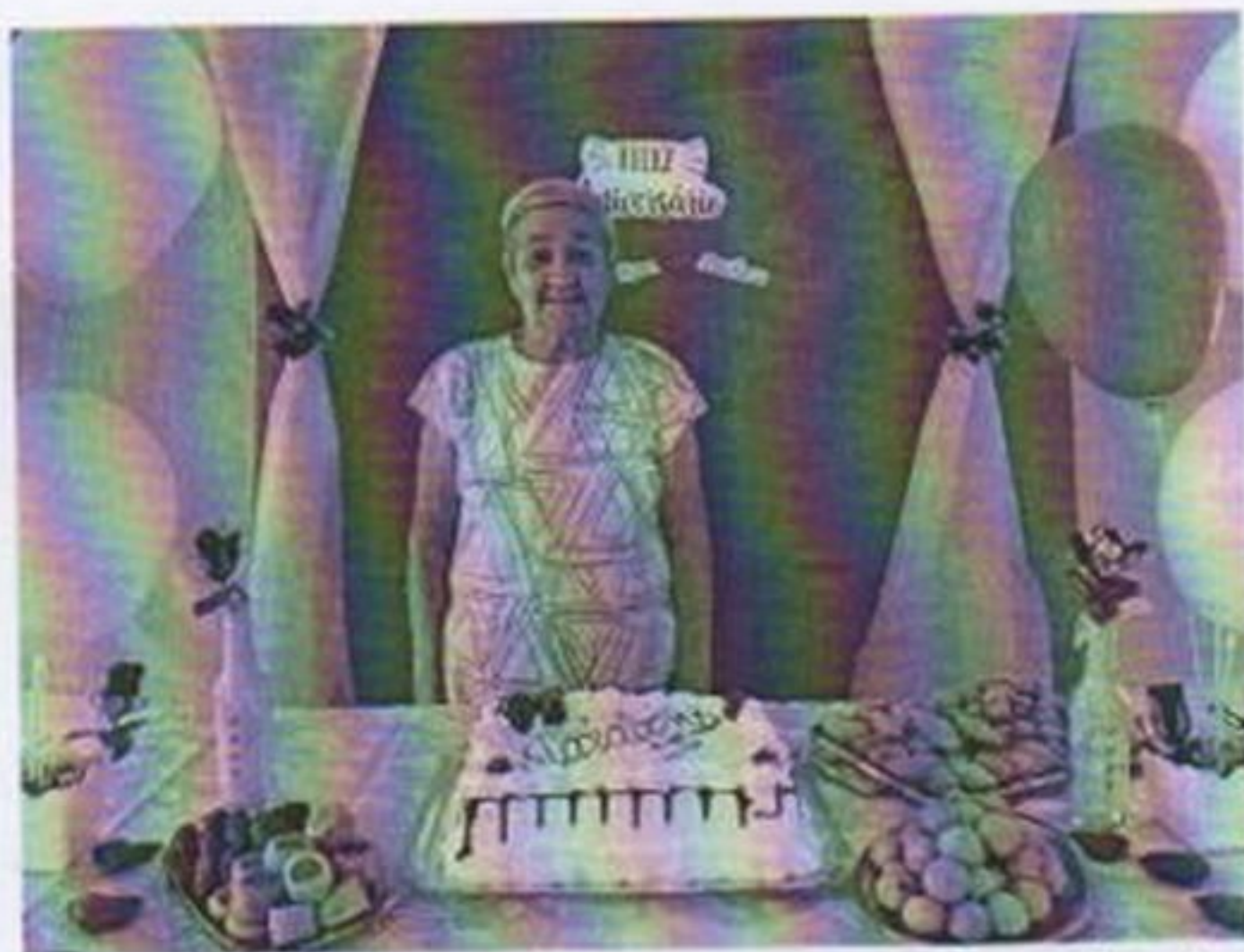
Alimentos para comemoração dos aniversariantes do mês