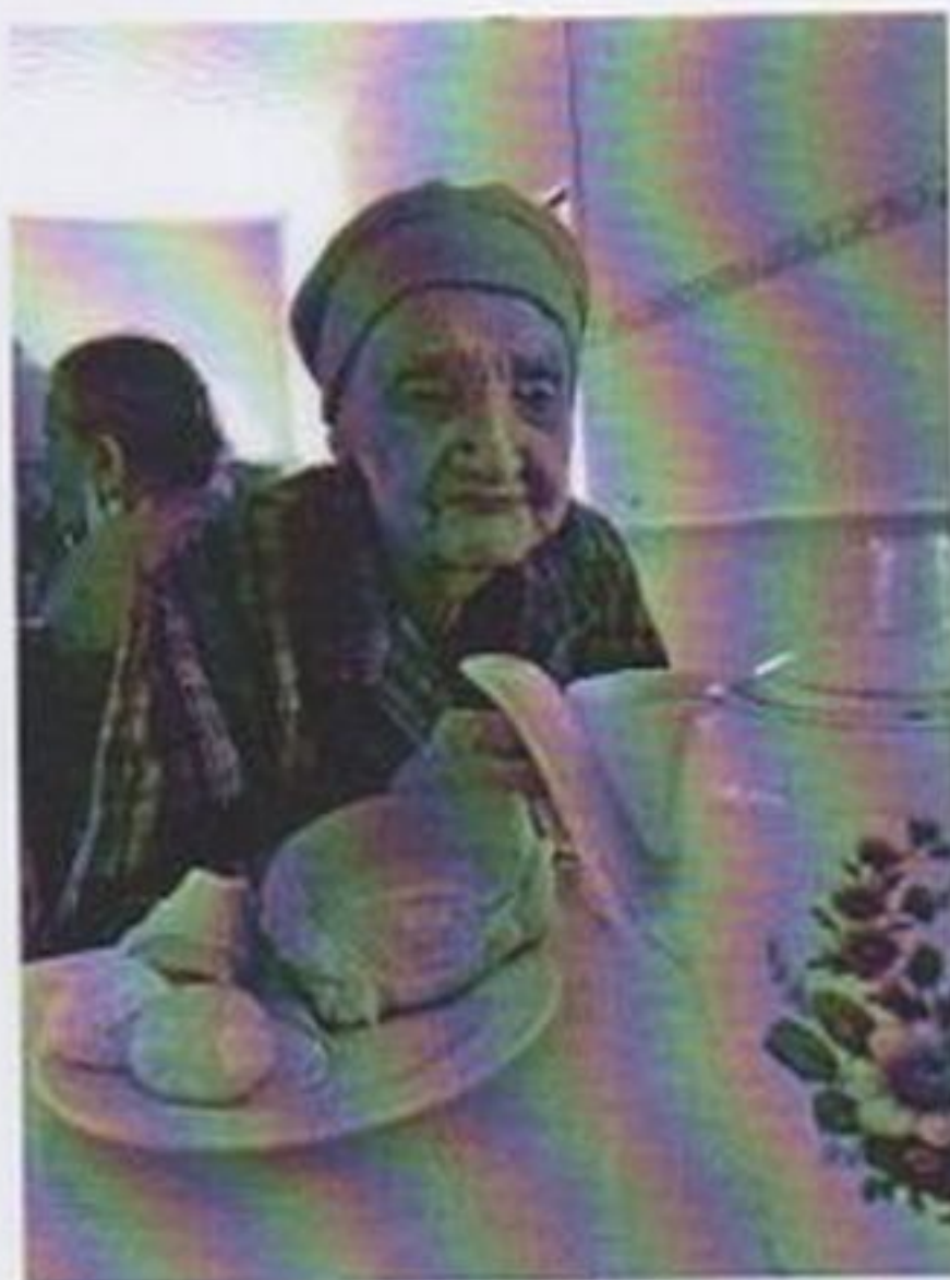
Café da tarde com lanche diversos

CEBAS nº 71000.070949 – Lei de Utilidade Pública Municipal nº 578/81 de 11 de março de 1981. Utilidade Pública Estadual, Decreto nº 47.480 de 19/12/02 – CRCE 0659/2012