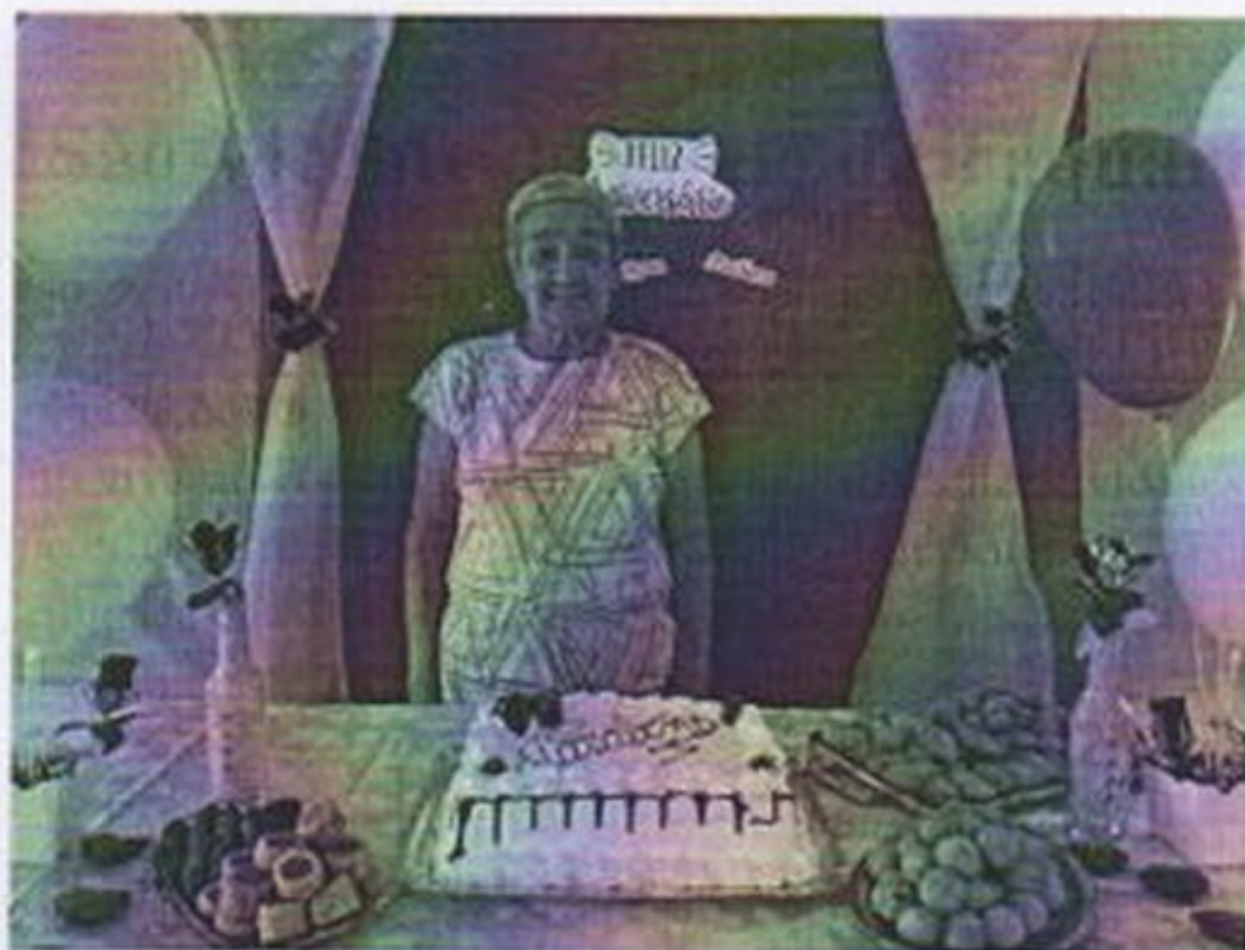
Alimentos para comemoração dos aniversariantes do mês