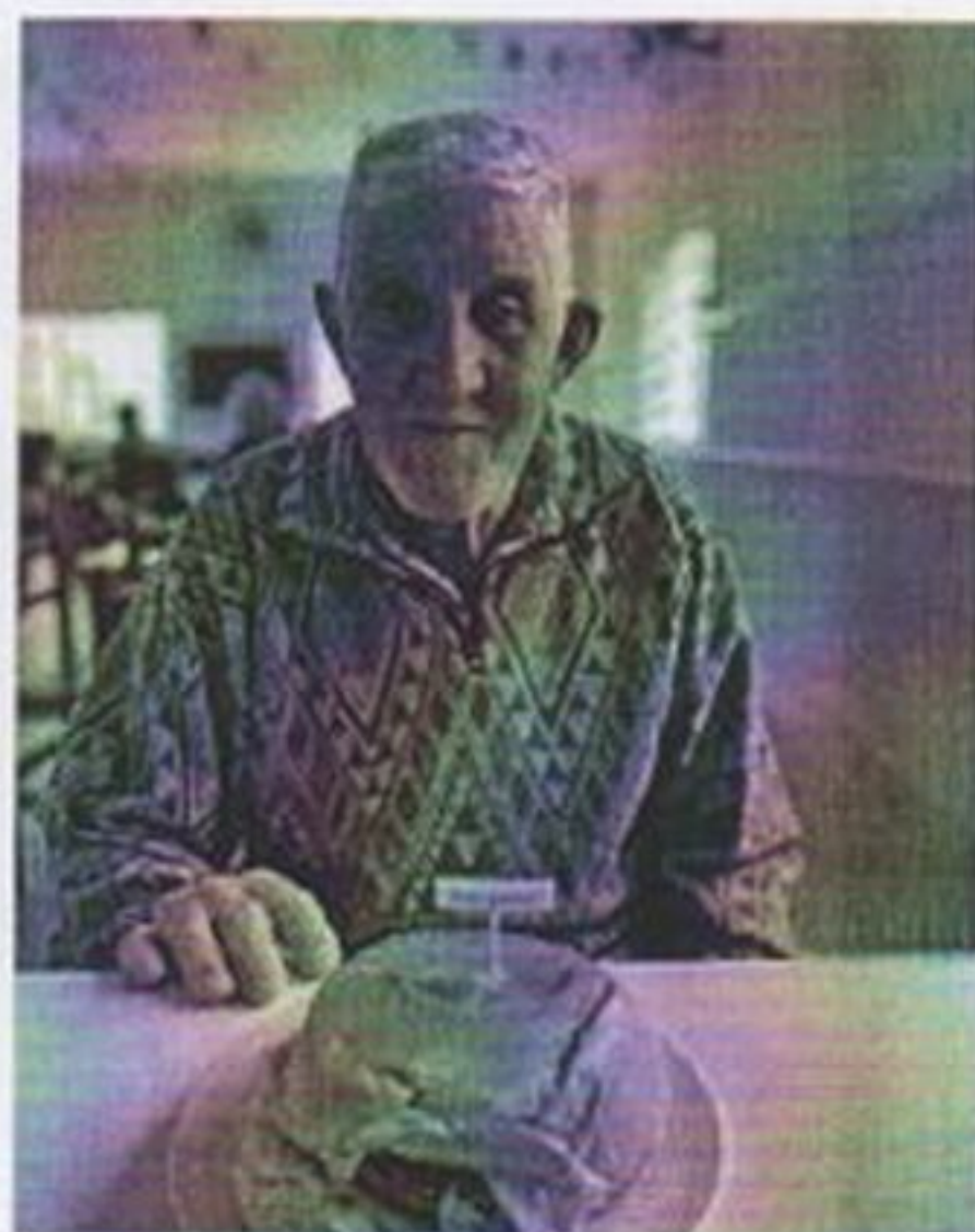
Café da tarde