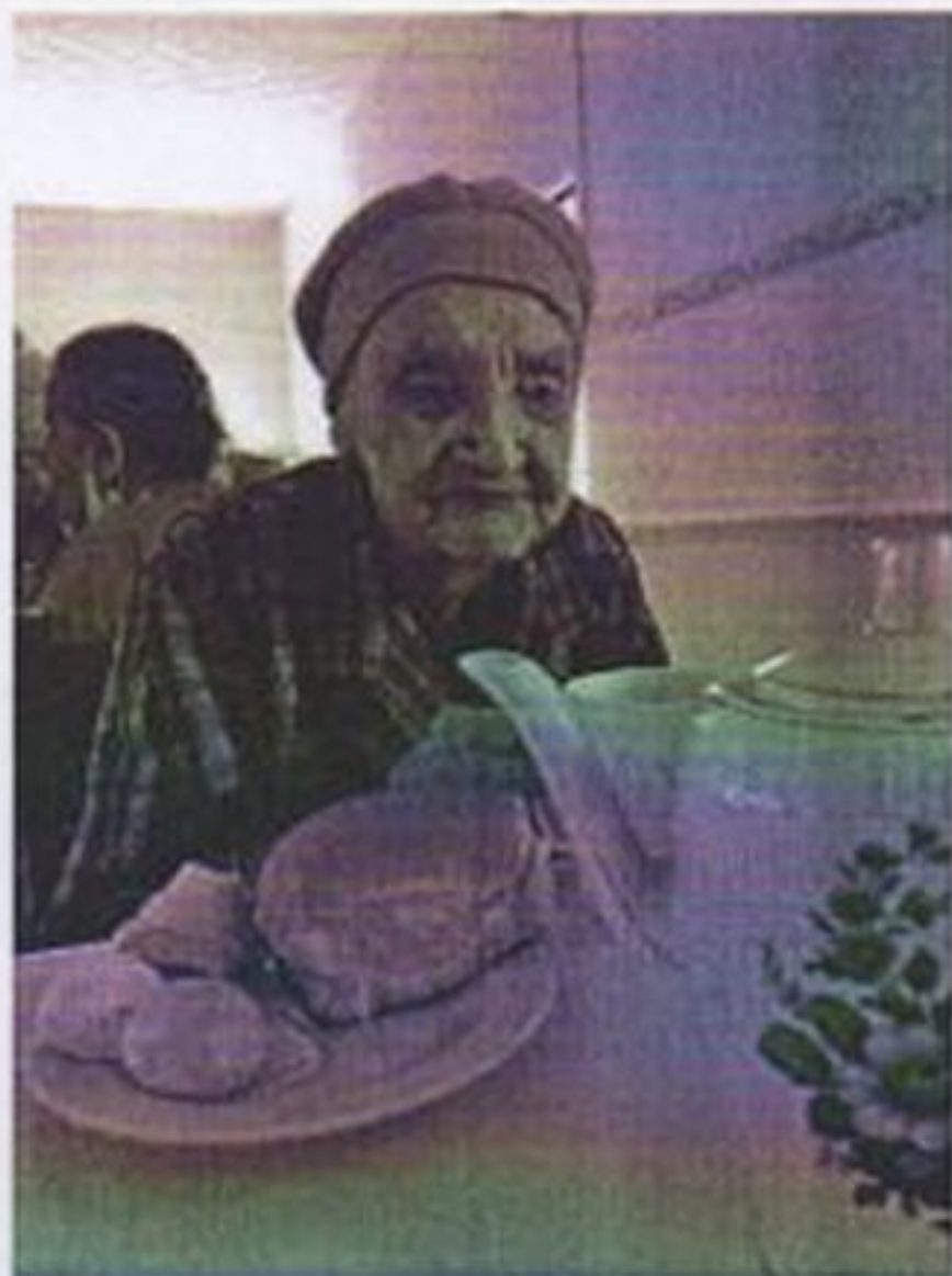
Café da tarde

CEBAS nº 71000.070949 – Lei de Utilidade Pública Municipal nº 578/81 de 11 de março de 1981. Utilidade Pública Estadual, Decreto nº 47.480 de 19/12/02 – CRCE 0659/2012