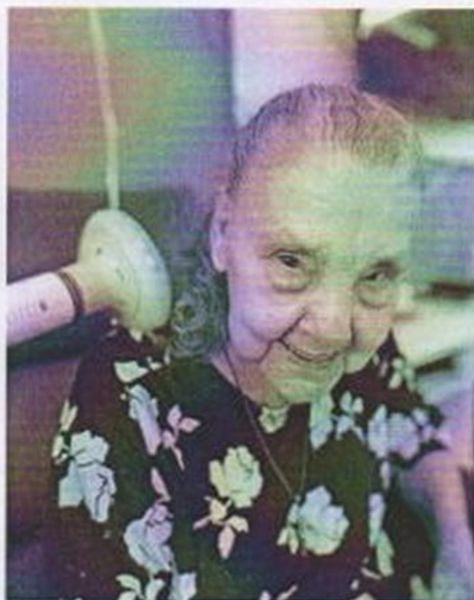
Atividade de distração com massagedor