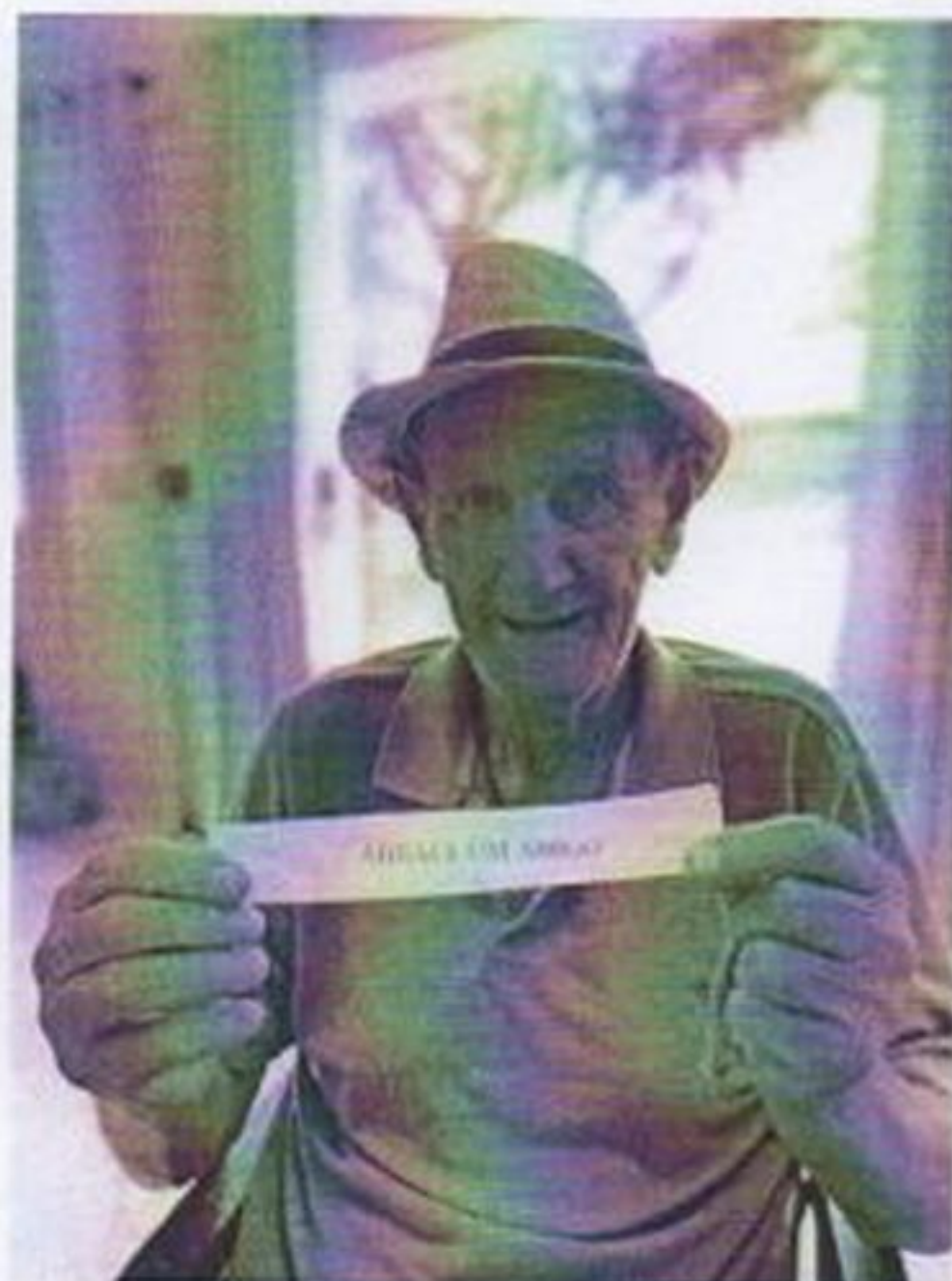
Atividade grupal de interação