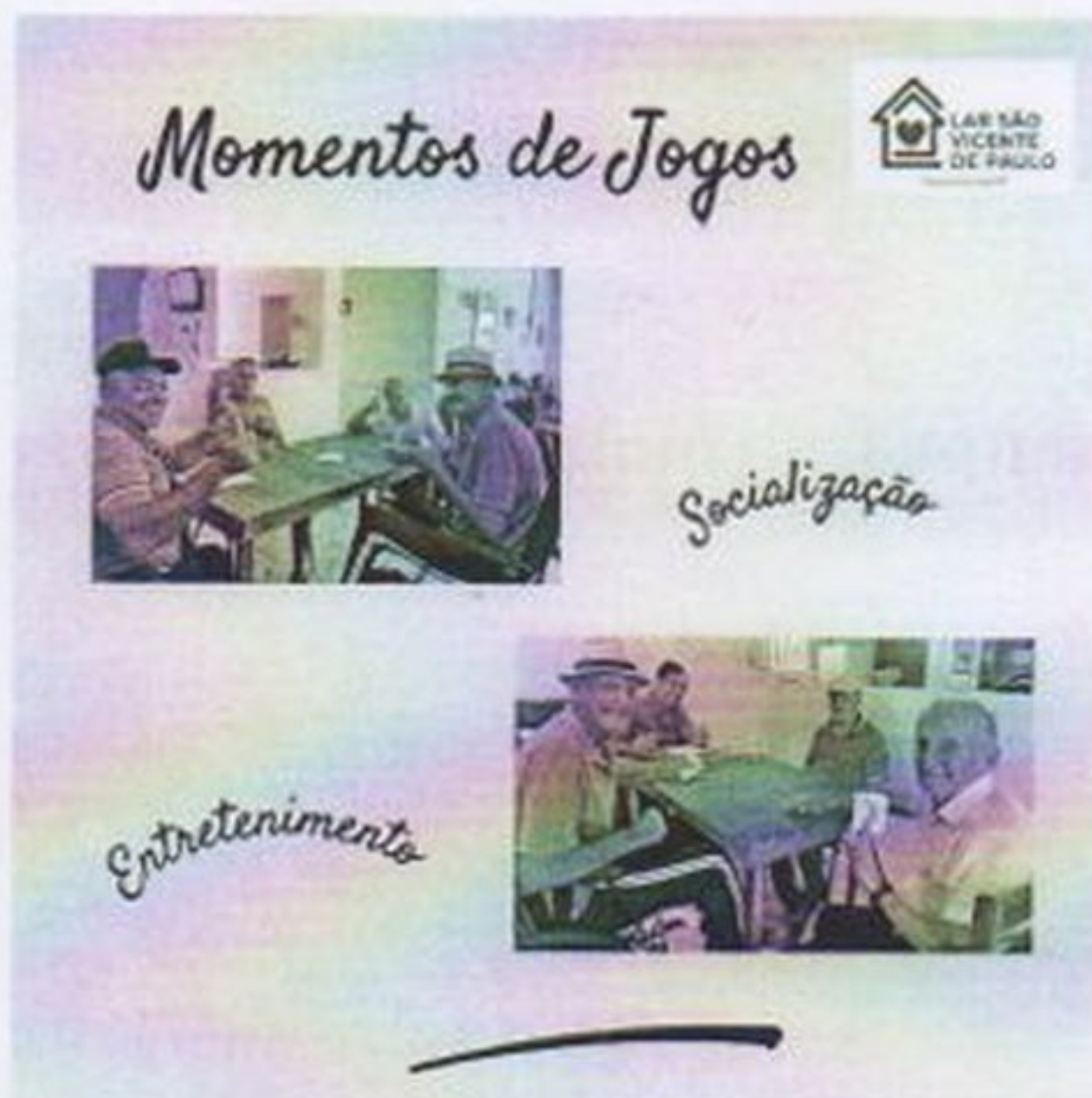
Atividade de jogos

CEBAS nº 71000.070949 – Lei de Utilidade Pública Municipal nº 578/81 de 11 de março de 1981. Utilidade Pública Estadual, Decreto nº 47.480 de 19/12/02 – CRCE 0659/2012