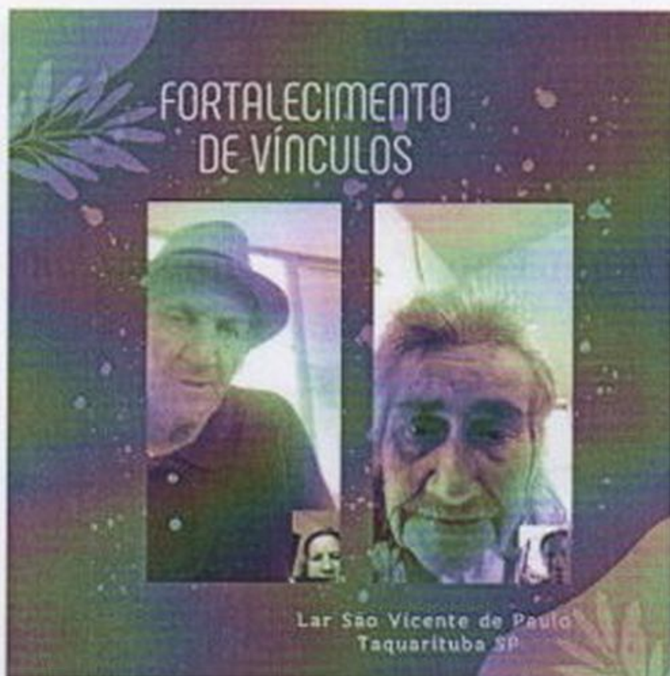
Trabalho de fortalecimento de vínculos

CEBAS nº 71000.070949 – Lei de Utilidade Pública Municipal nº 578/81 de 11 de março de 1981. Utilidade Pública Estadual, Decreto nº 47.480 de 19/12/02 – CRCE 0659/2012