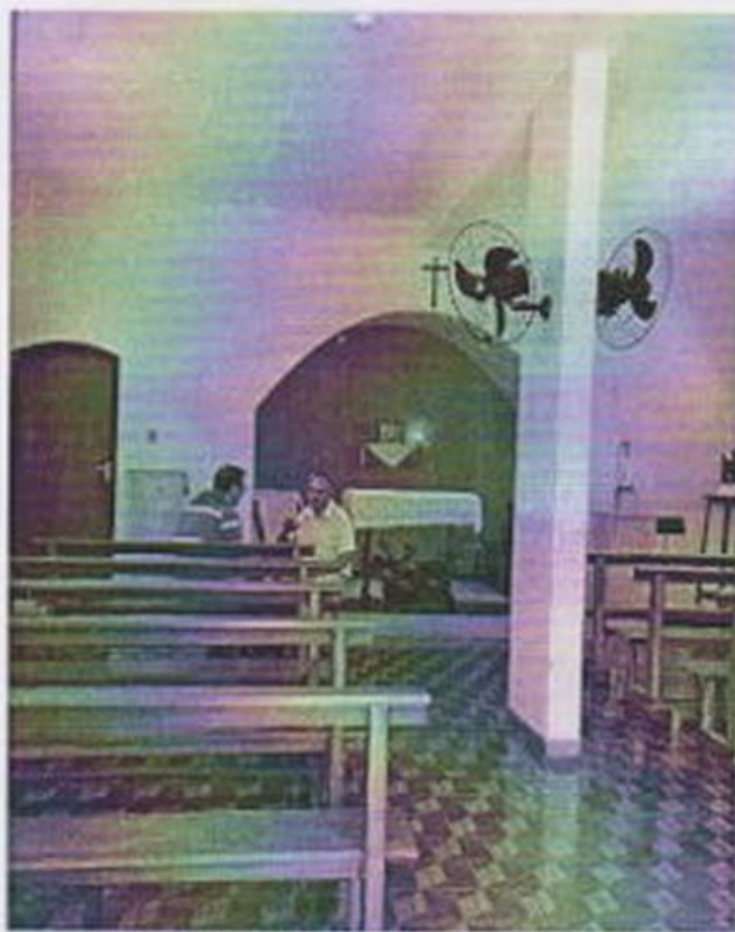
Movimento de confissão para idosos