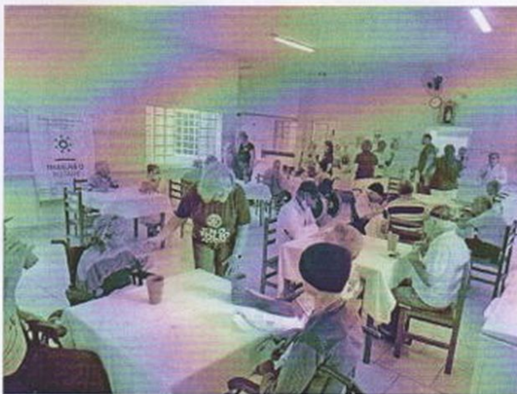
Café da tarde especial com visita dos Rotaryanos