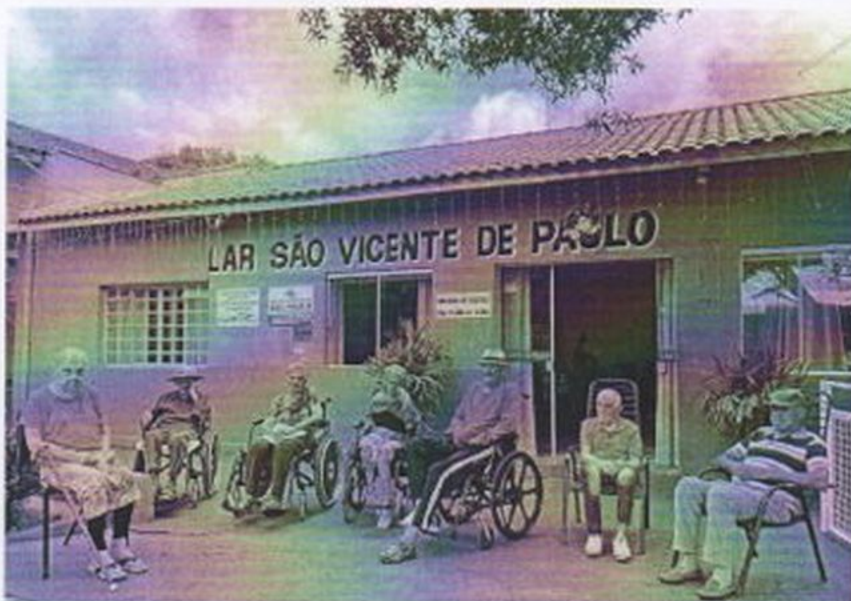
Roda de conversa