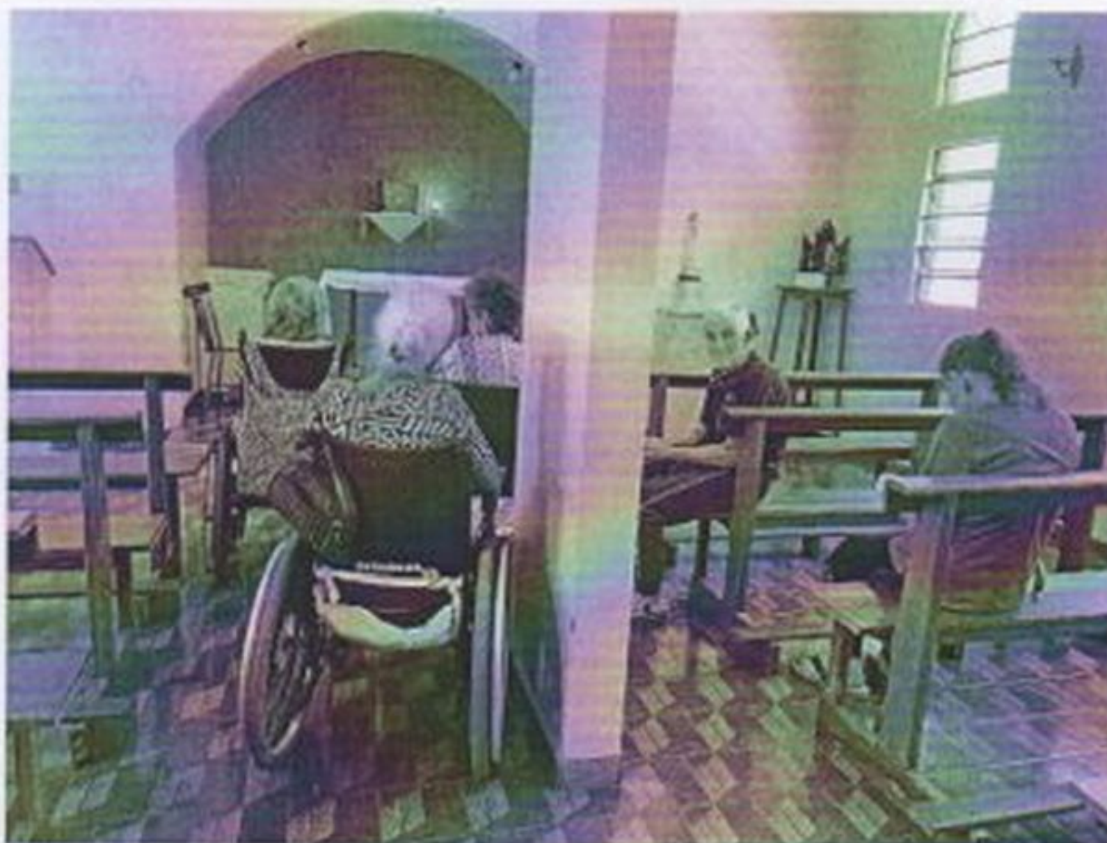
Momento de oração na capela da Entidade

CEBAS nº 71000.070949 – Lei de Utilidade Pública Municipal nº 578/81 de 11 de março de 1981. Utilidade Pública Estadual, Decreto nº 47.480 de 19/12/02 – CRCE 0659/2012