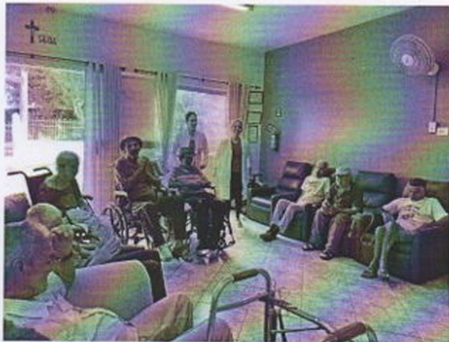
Atividade grupal de interação

CEBAS nº 71000.070949 – Lei de Utilidade Pública Municipal nº 578/81 de 11 de março de 1981. Utilidade Pública Estadual, Decreto nº 47.480 de 19/12/02 – CRCE 0659/2012