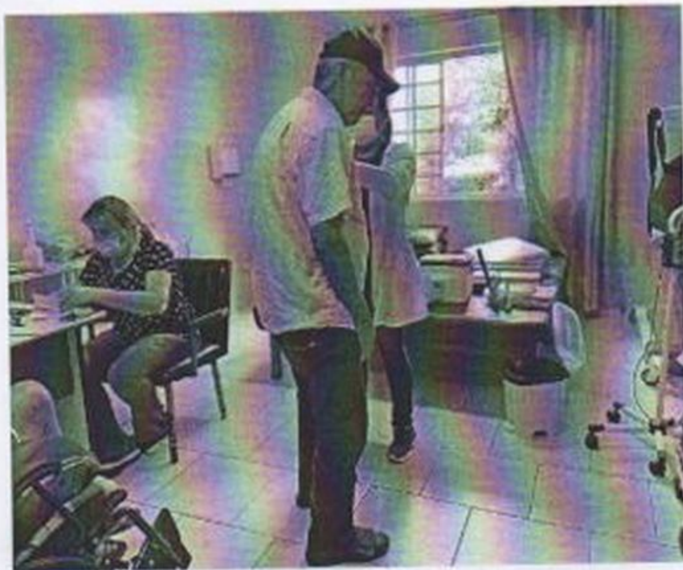
Vacinação bivalente covid

CEBAS nº 71000.070949 – Lei de Utilidade Pública Municipal nº 578/81 de 11 de março de 1981. Utilidade Pública Estadual, Decreto nº 47.480 de 19/12/02 – CRCE 0659/2012