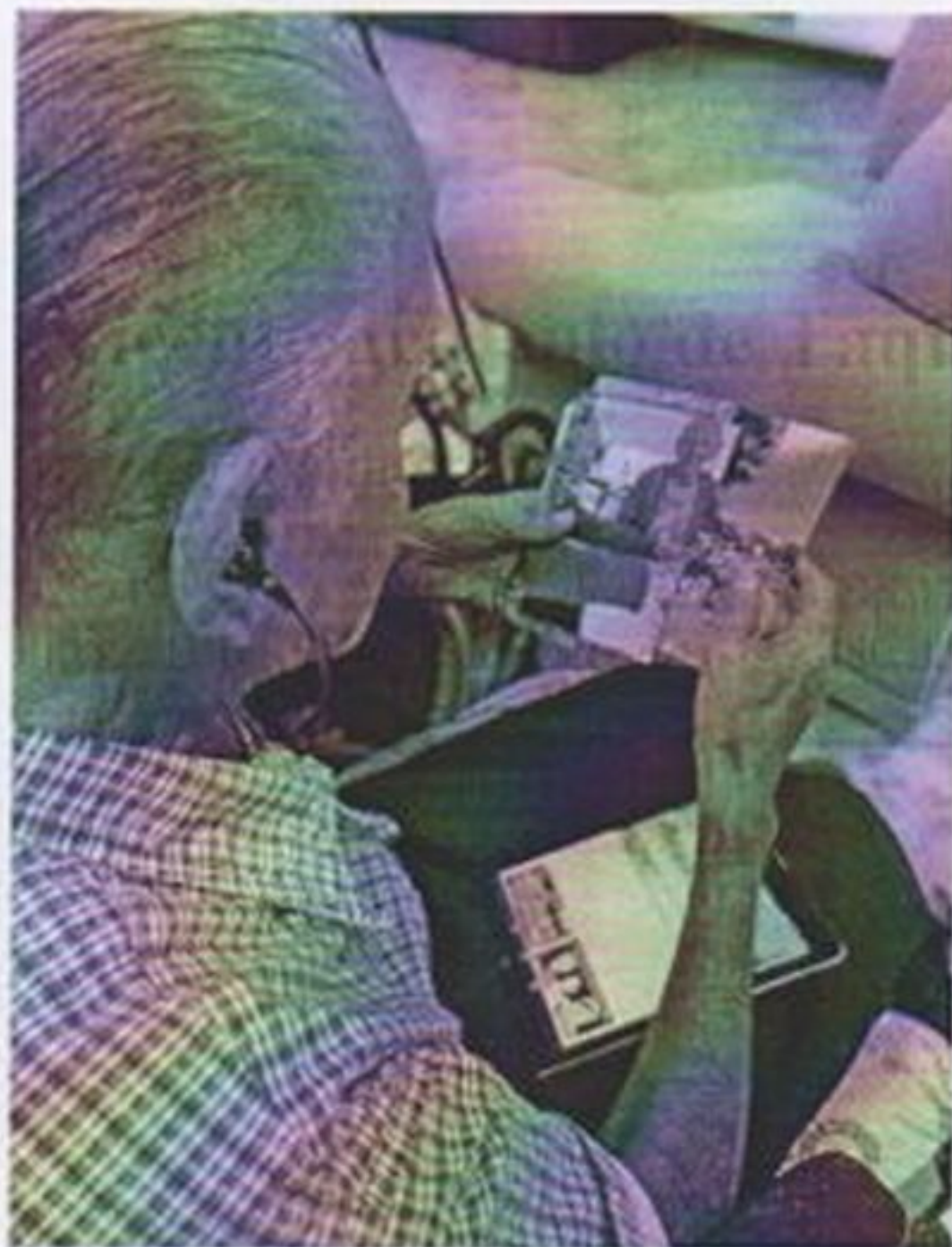
Atividade para relembrar momentos