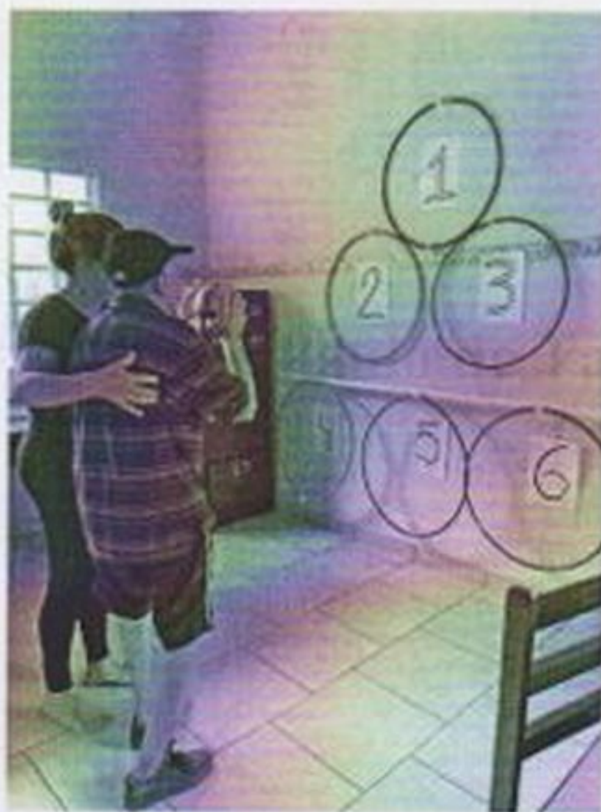
Circuito de atividade

CEBAS nº 71000.070949 – Lei de Utilidade Pública Municipal nº 578/81 de 11 de março de 1981. Utilidade Pública Estadual, Decreto nº 47.480 de 19/12/02 – CRCE 0659/2012