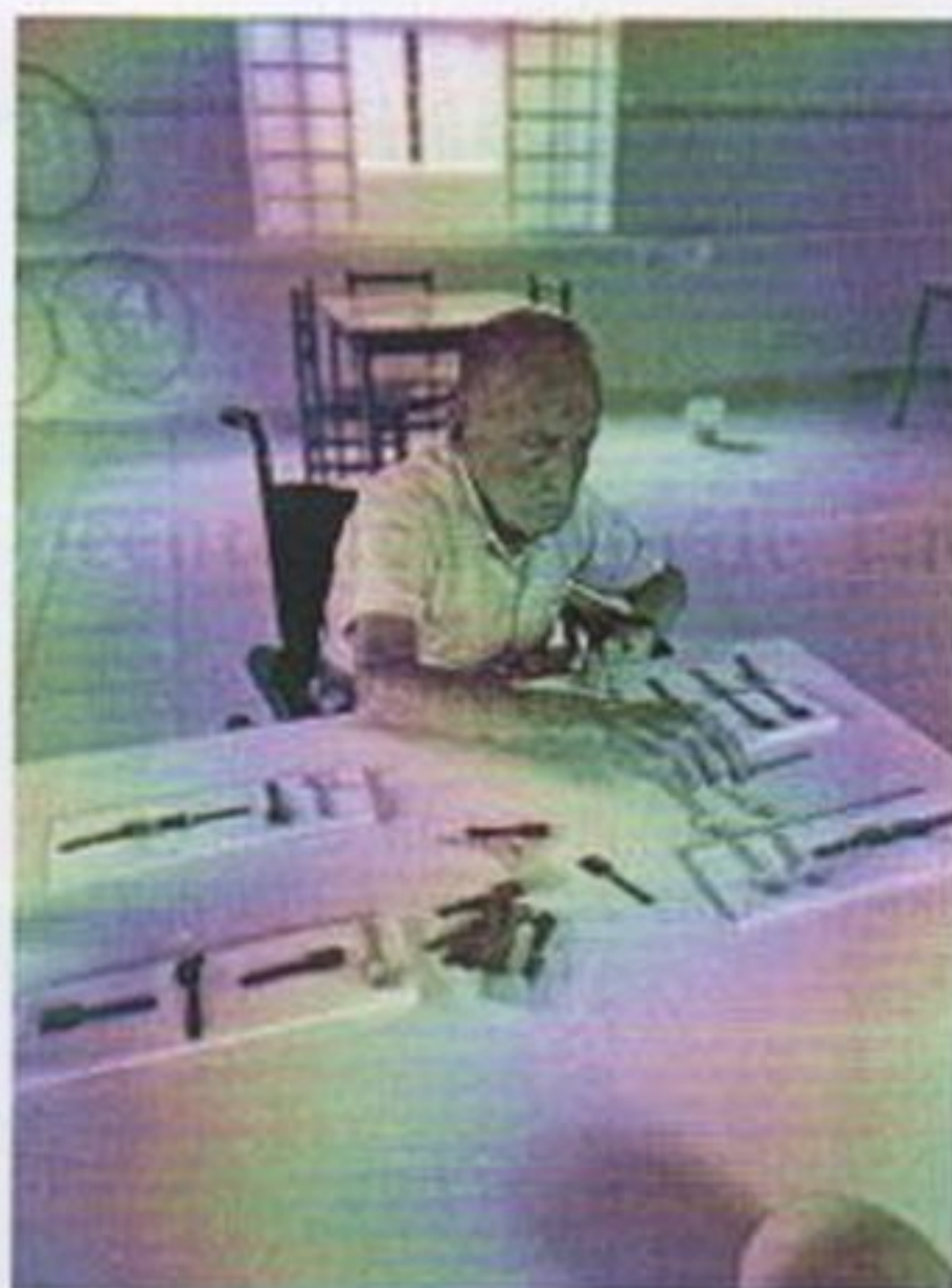
Circuito de atividade

CEBAS nº 71000.070949 – Lei de Utilidade Pública Municipal nº 578/81 de 11 de março de 1981. Utilidade Pública Estadual, Decreto nº 47.480 de 19/12/02 – CRCE 0659/2012