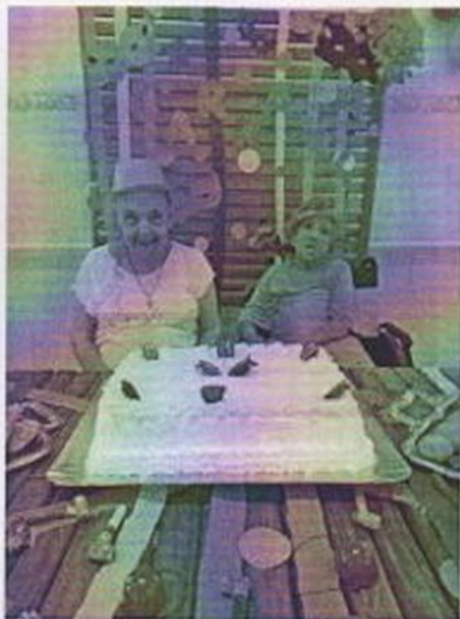
Comemoração aniversariantes no mês