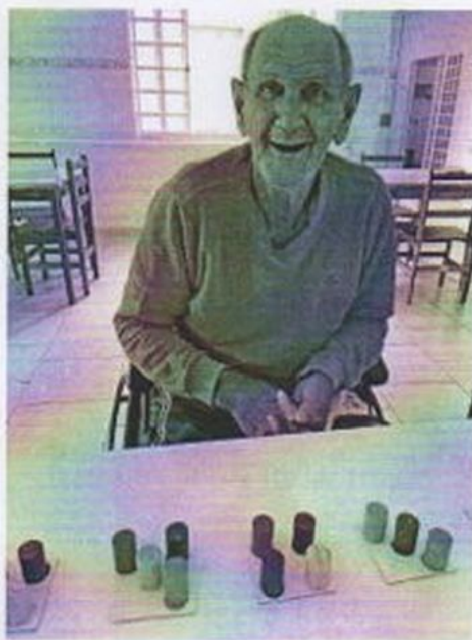
Circuito de atividade