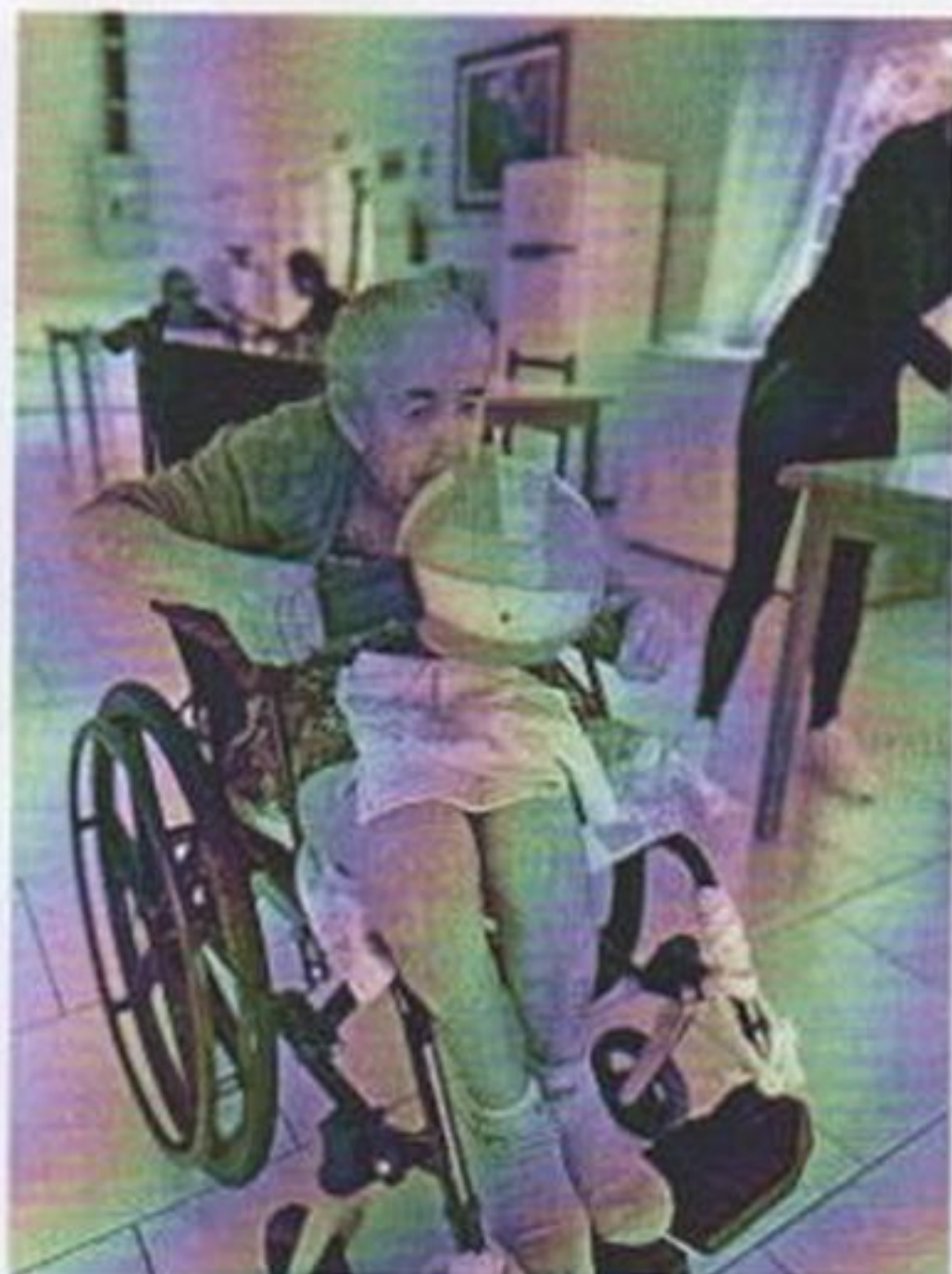
Circuito de atividade

CEBAS nº 71000.070949 – Lei de Utilidade Pública Municipal nº 578/81 de 11 de março de 1981. Utilidade Pública Estadual, Decreto nº 47.480 de 19/12/02 – CRCE 0659/2012