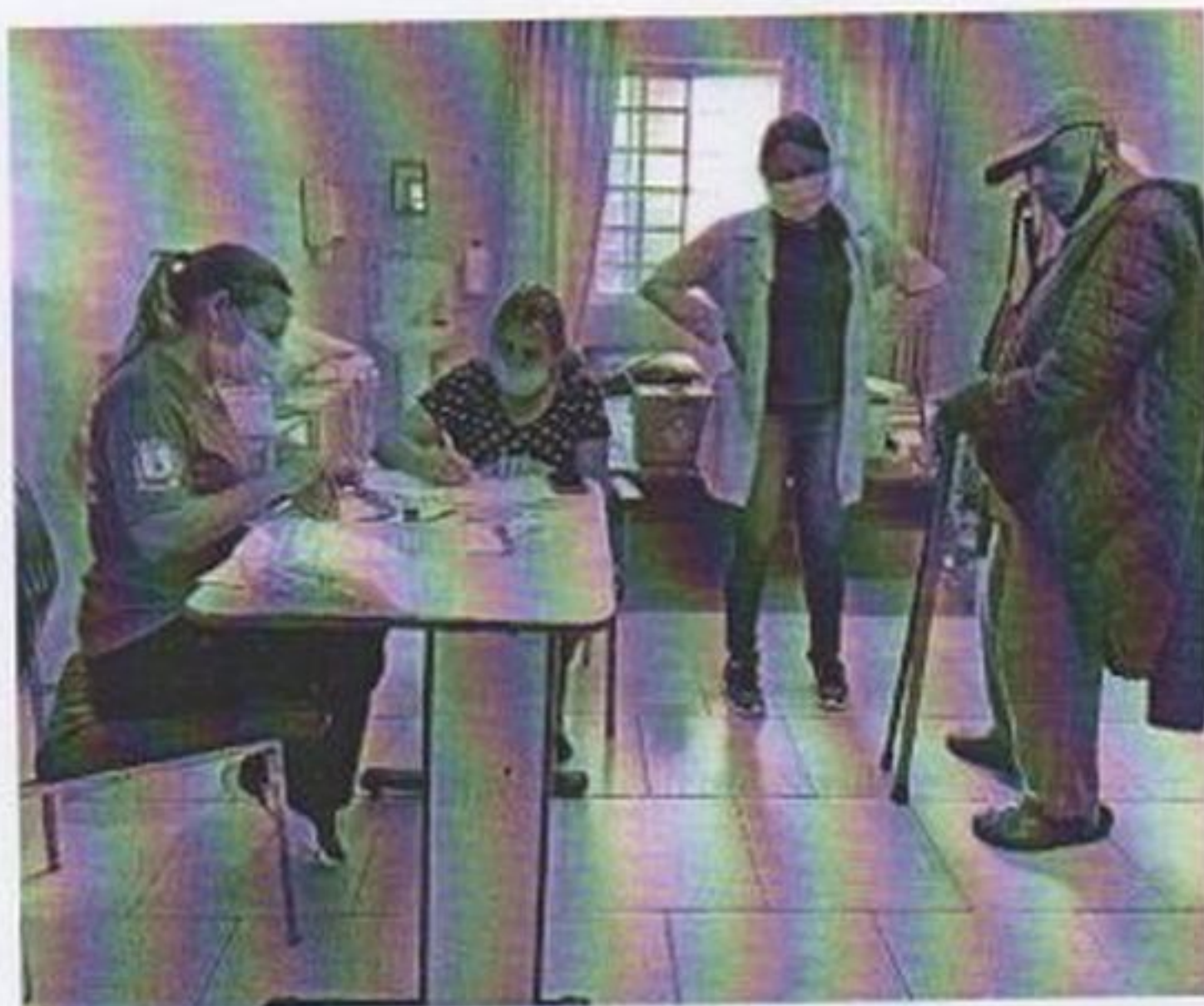
Vacinação bivalente covid