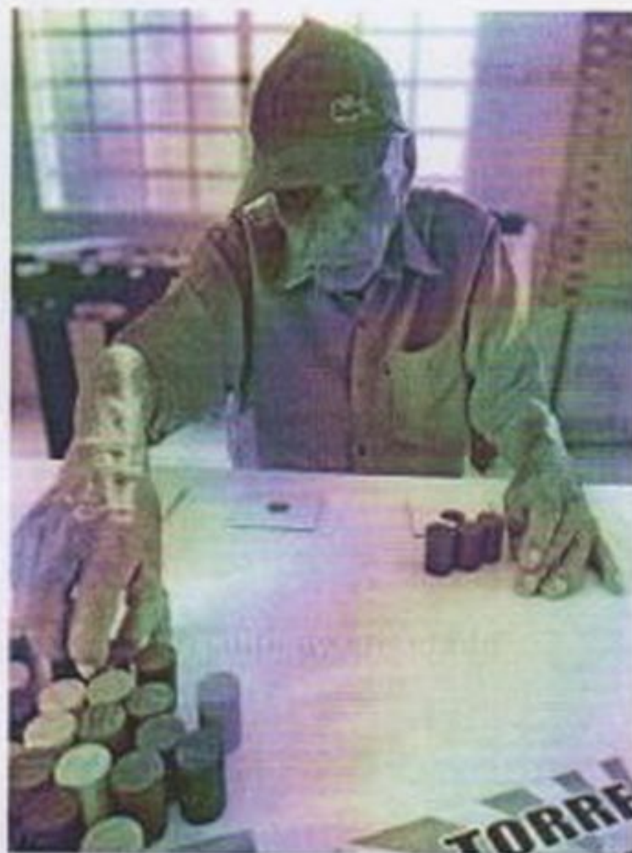
Circuito de atividade