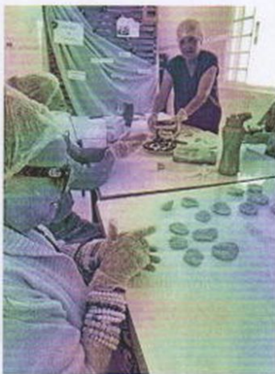
Oficina de culinária