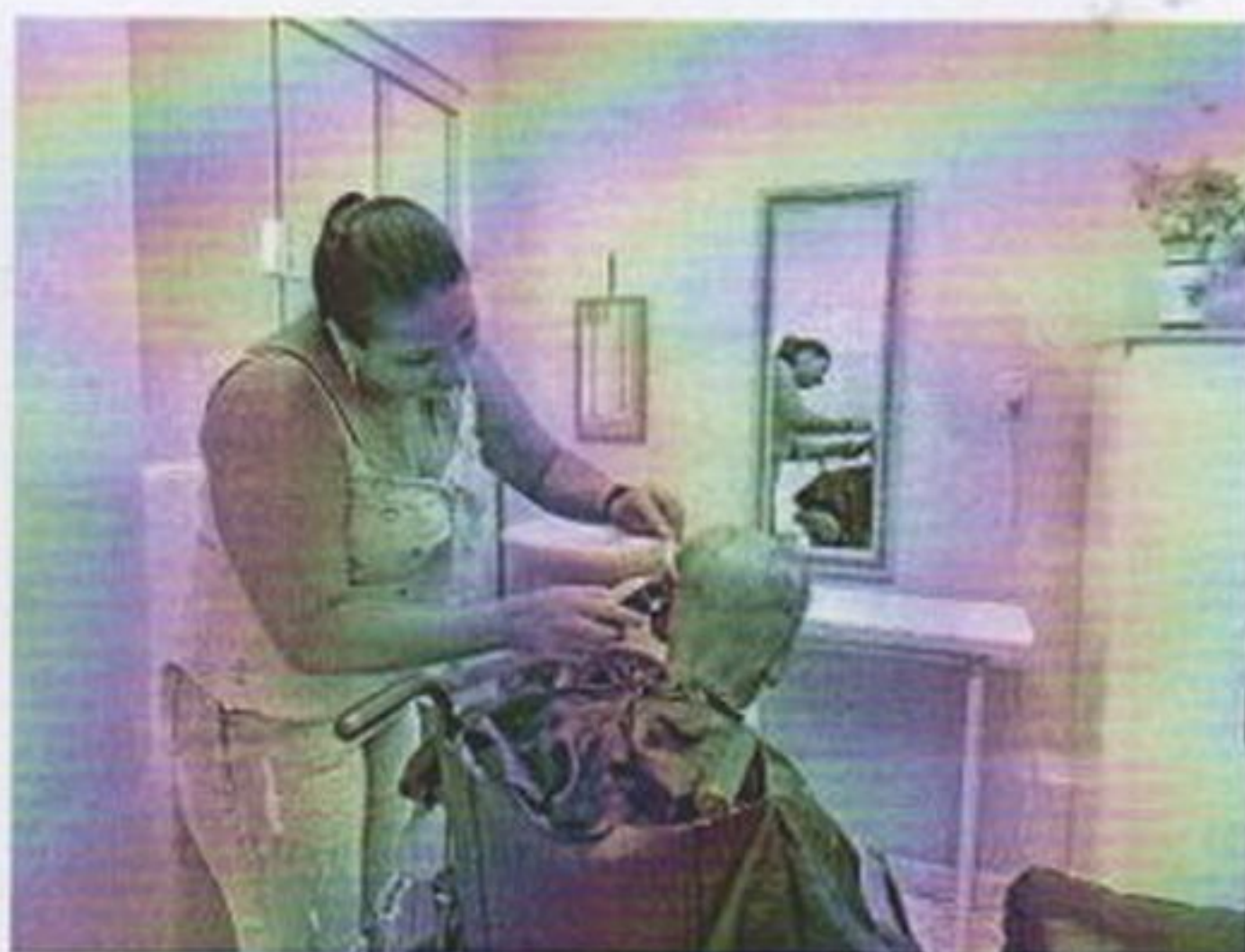
Dia de Beleza