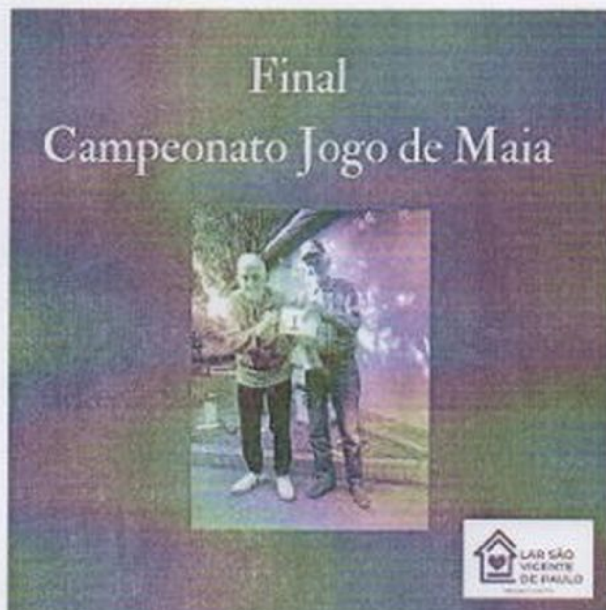
Campeonato de maia