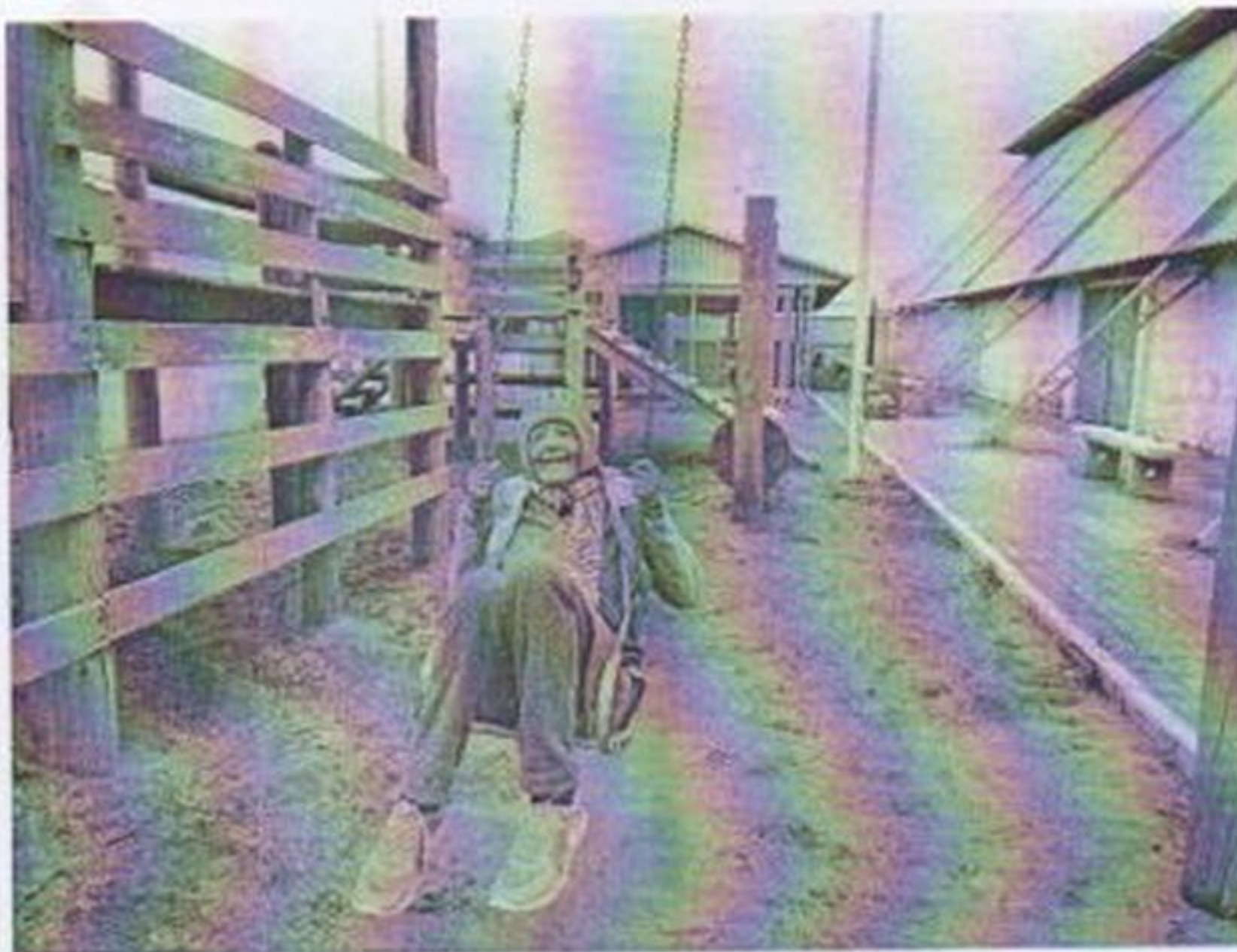
Atividade da praça

CEBAS nº 71000.070949 – Lei de Utilidade Pública Municipal nº 578/81 de 11 de março de 1981. Utilidade Pública Estadual, Decreto nº 47.480 de 19/12/02 – CRCE 0659/2012