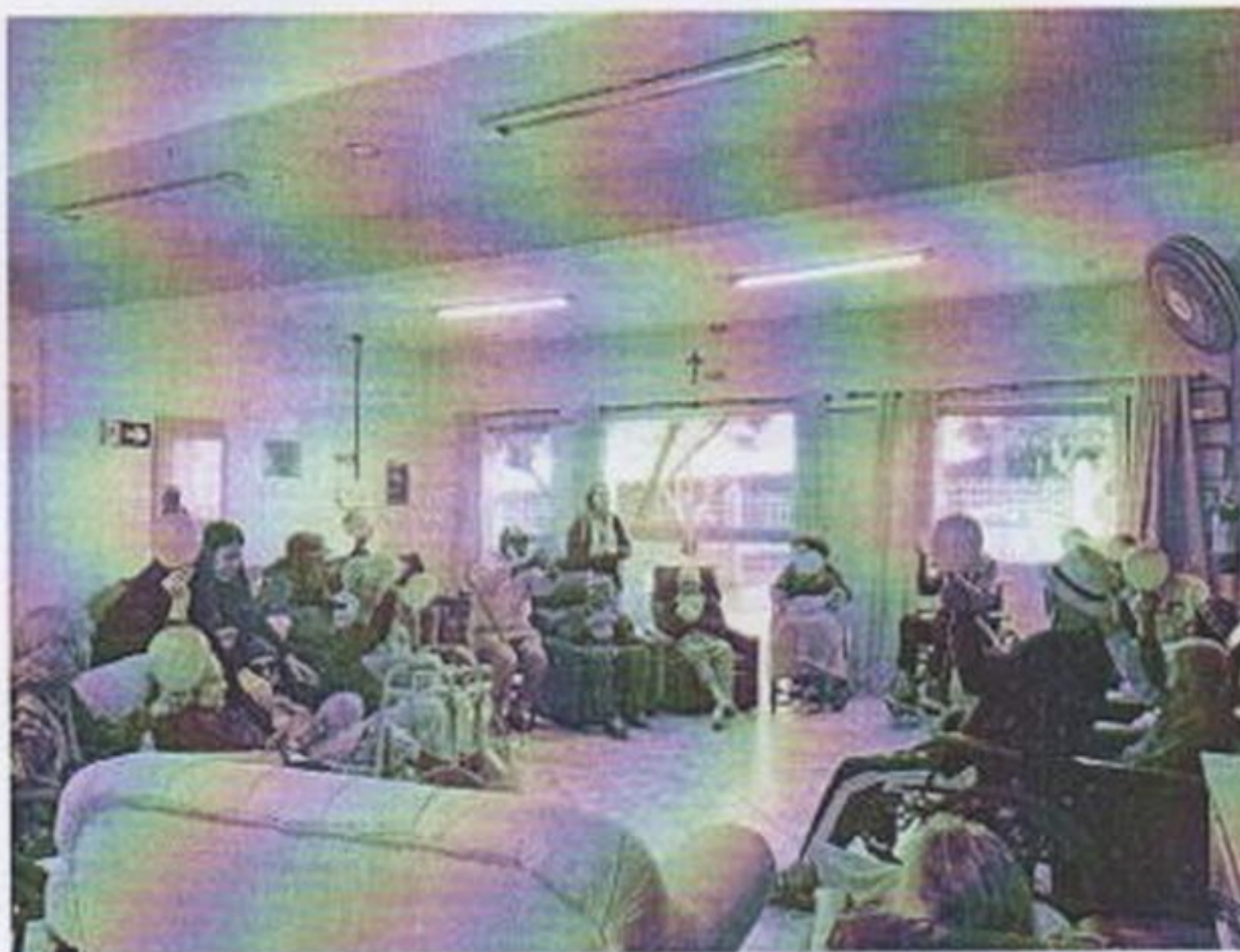
Atividade Junho Violeta