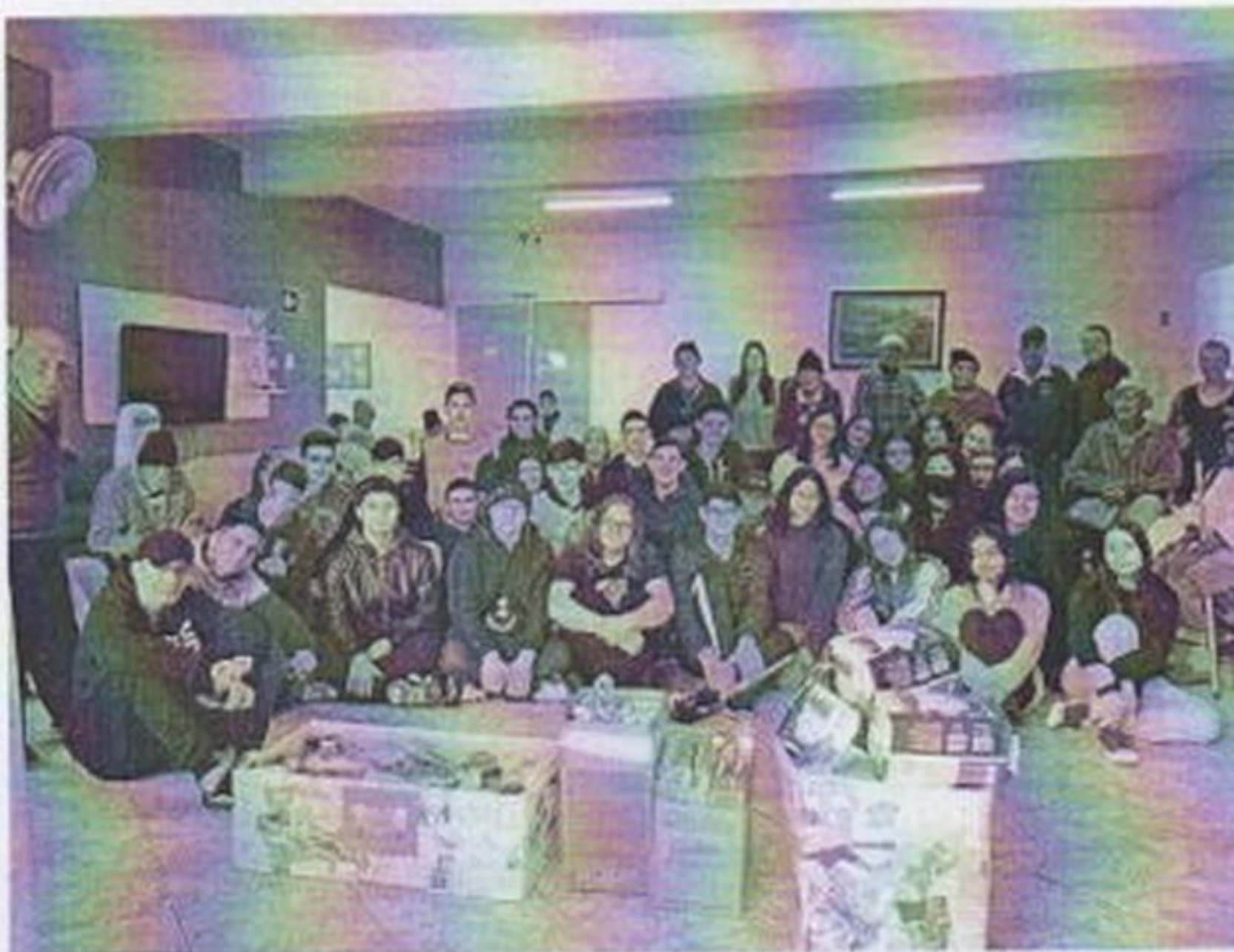
Visita escola Etec e entrega de produtos higiene da campanha

CEBAS nº 71000.070949 – Lei de Utilidade Pública Municipal nº 578/81 de 11 de março de 1981. Utilidade Pública Estadual, Decreto nº 47.480 de 19/12/02 – CRCE 0659/2012