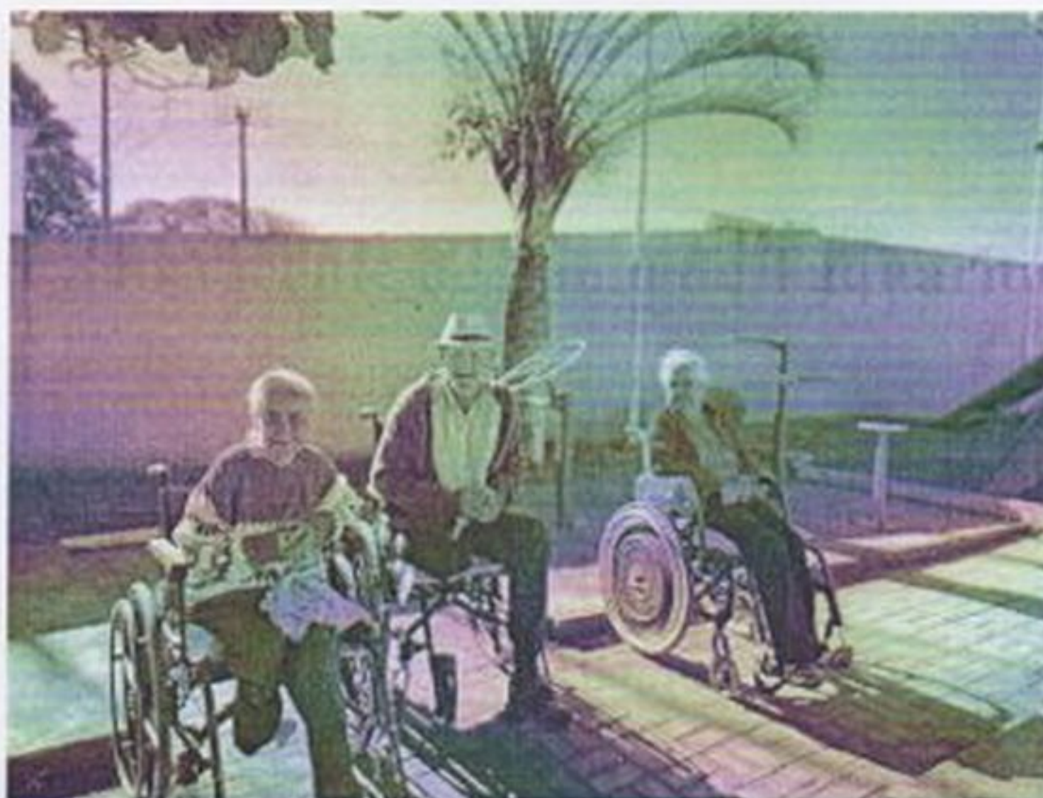
Atividade da praça