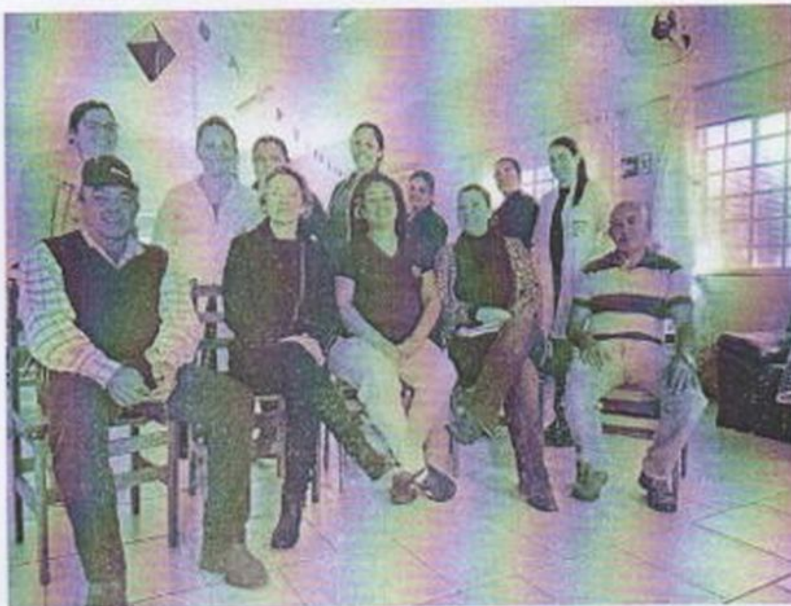
Bate papo com psicóloga e funcionários sobre Junho Violeta