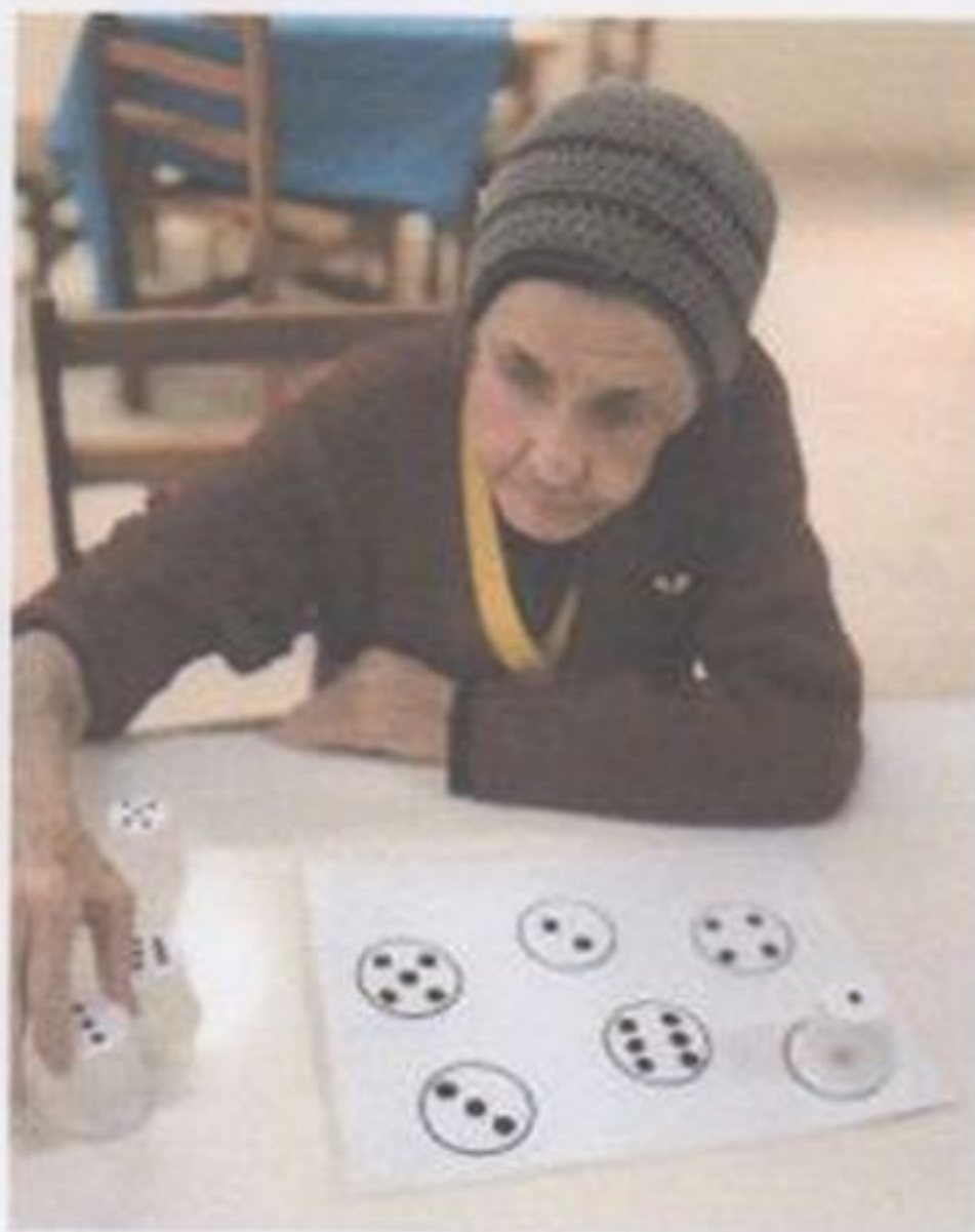
Trabalhando cores, números e símbolos!

CEBAS nº 71000.070949 – Lei de Utilidade Pública Municipal nº 578/81 de 11 de março de 1981. Utilidade Pública Estadual, Decreto nº 47.480 de 19/12/02 – CRCE 0659/2012