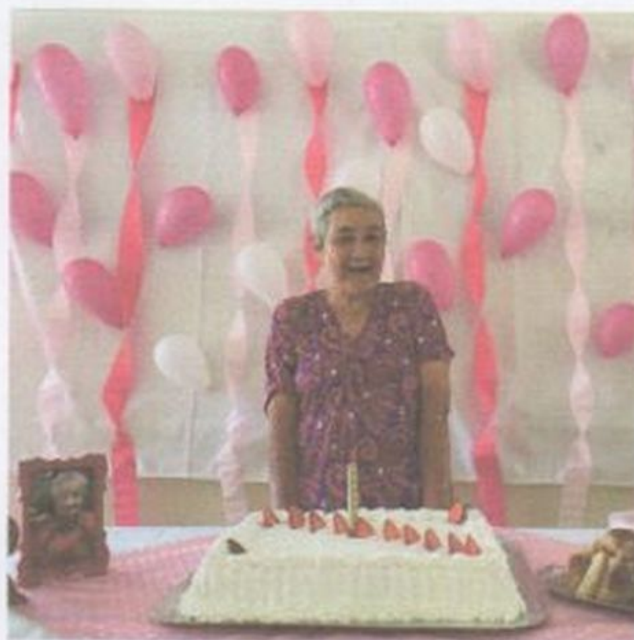
Aniversario do mês