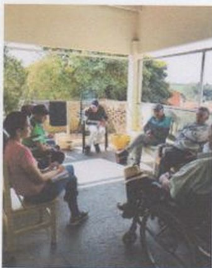
Roda de conversa - classe proletária x classe burguesa e Quebrando tabus sobre dinheiro, respeito e cidadania.