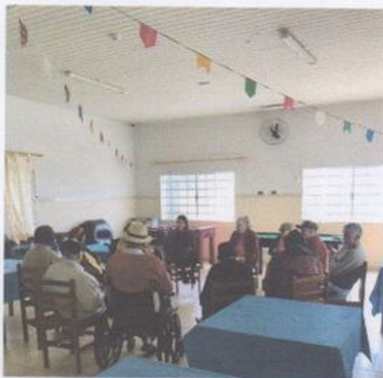
Roda de conversa sobre luto