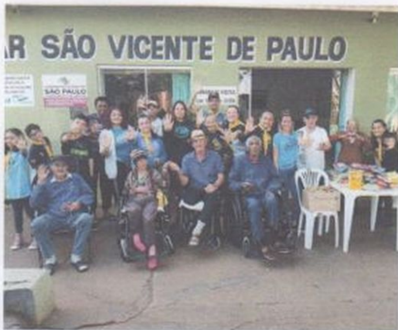
Visita do distrito de Itai da Igreja adventista do sétimo dia

CEBAS nº 71000.070949 – Lei de Utilidade Pública Municipal nº 578/81 de 11 de março de 1981. Utilidade Pública Estadual, Decreto nº 47.480 de 19/12/02 – CRCE 0659/2012