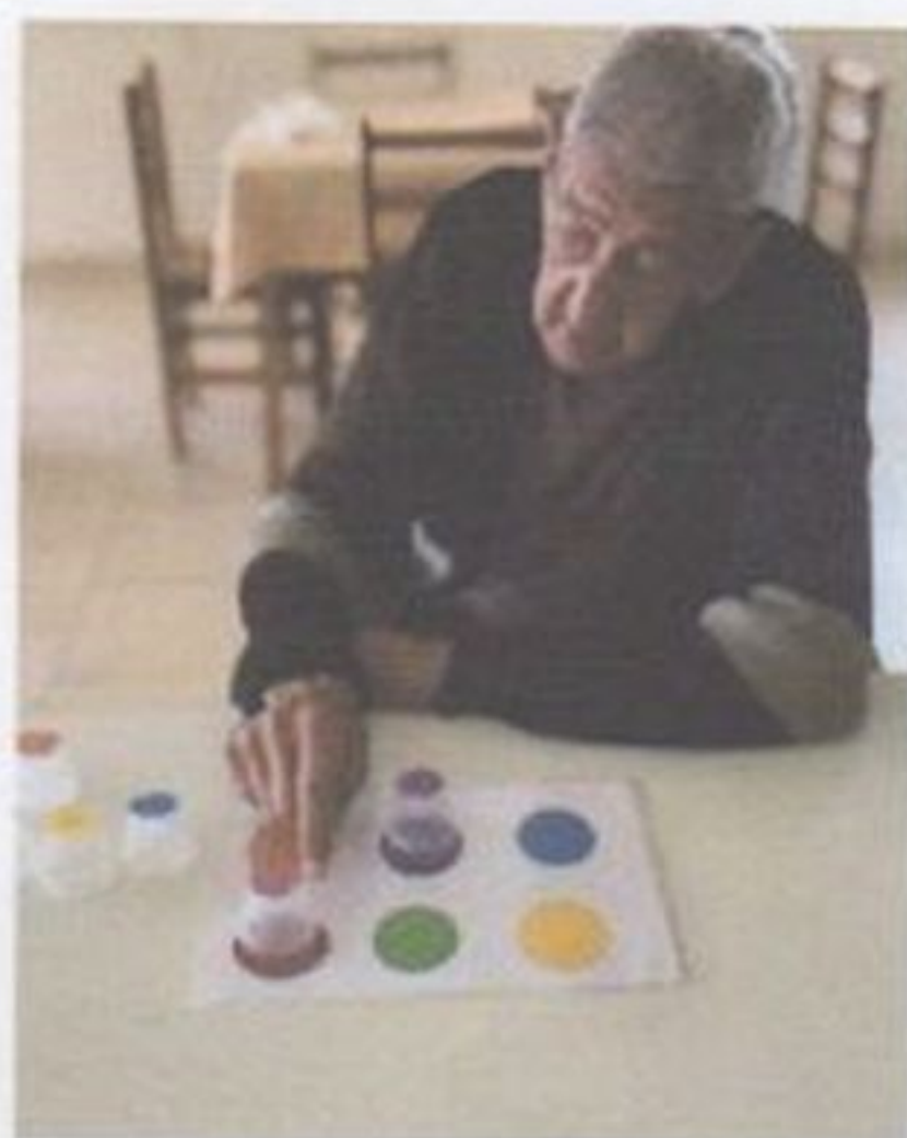
Trabalhando cores, números e símbolos!