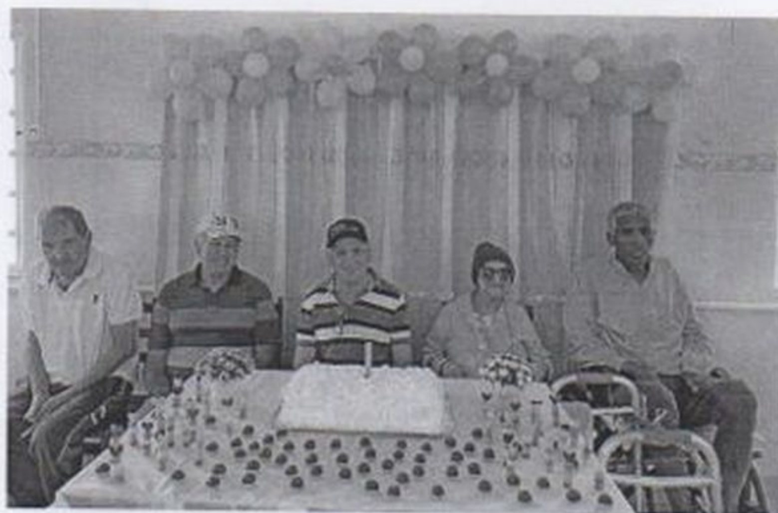
Comemoração dos aniversariante dos mês