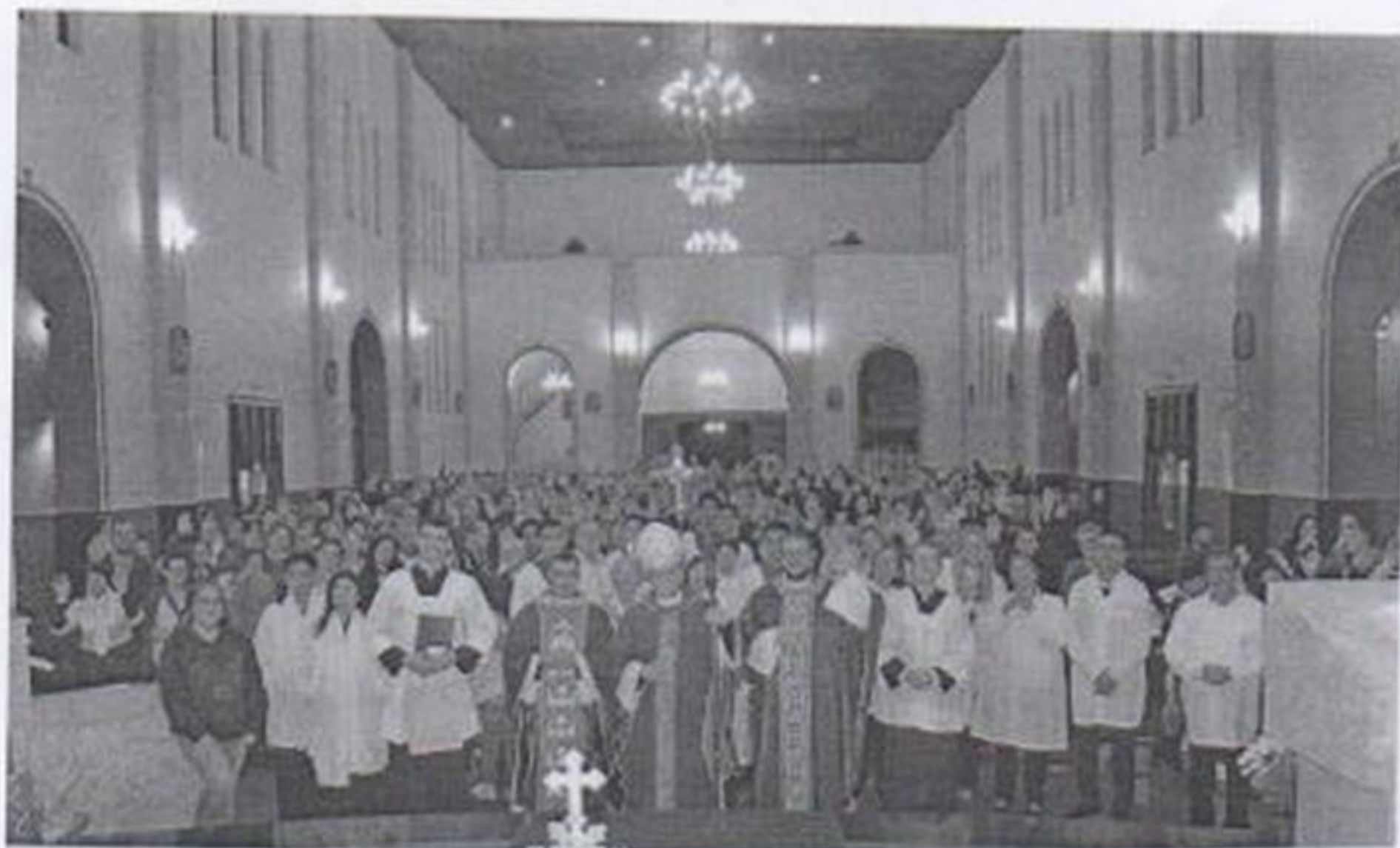
Participação dos idosos na novena de São Roque