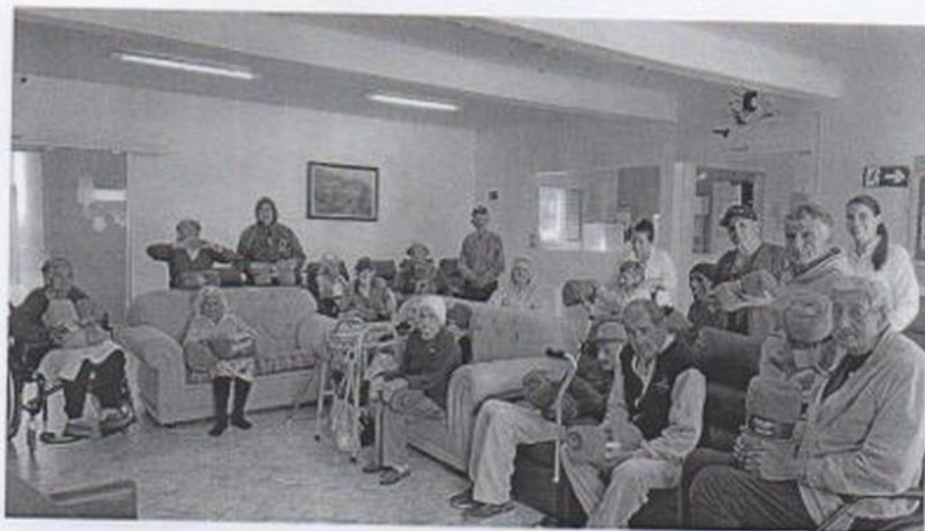
Recebimento de doação de cobertores