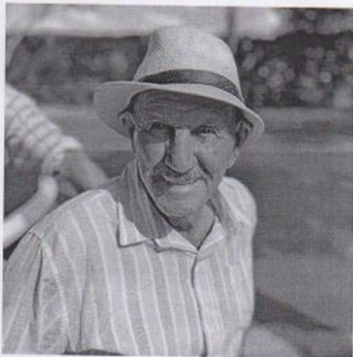
Cuidado com saúde nugal

CEBAS nº 71000.070949 – Lei de Utilidade Pública Municipal nº 578/81 de 11 de março de 1981. Utilidade Pública Estadual, Decreto nº 47.480 de 19/12/02 – CRCE 0659/2012