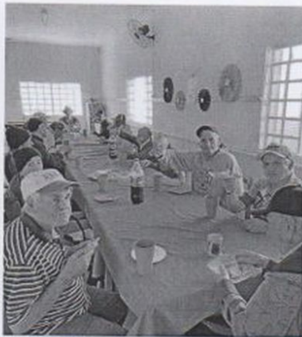
Comemoração dia dos pais

CEBAS nº 71000.070949 – Lei de Utilidade Pública Municipal nº 578/81 de 11 de março de 1981. Utilidade Pública Estadual, Decreto nº 47.480 de 19/12/02 – CRCE 0659/2012