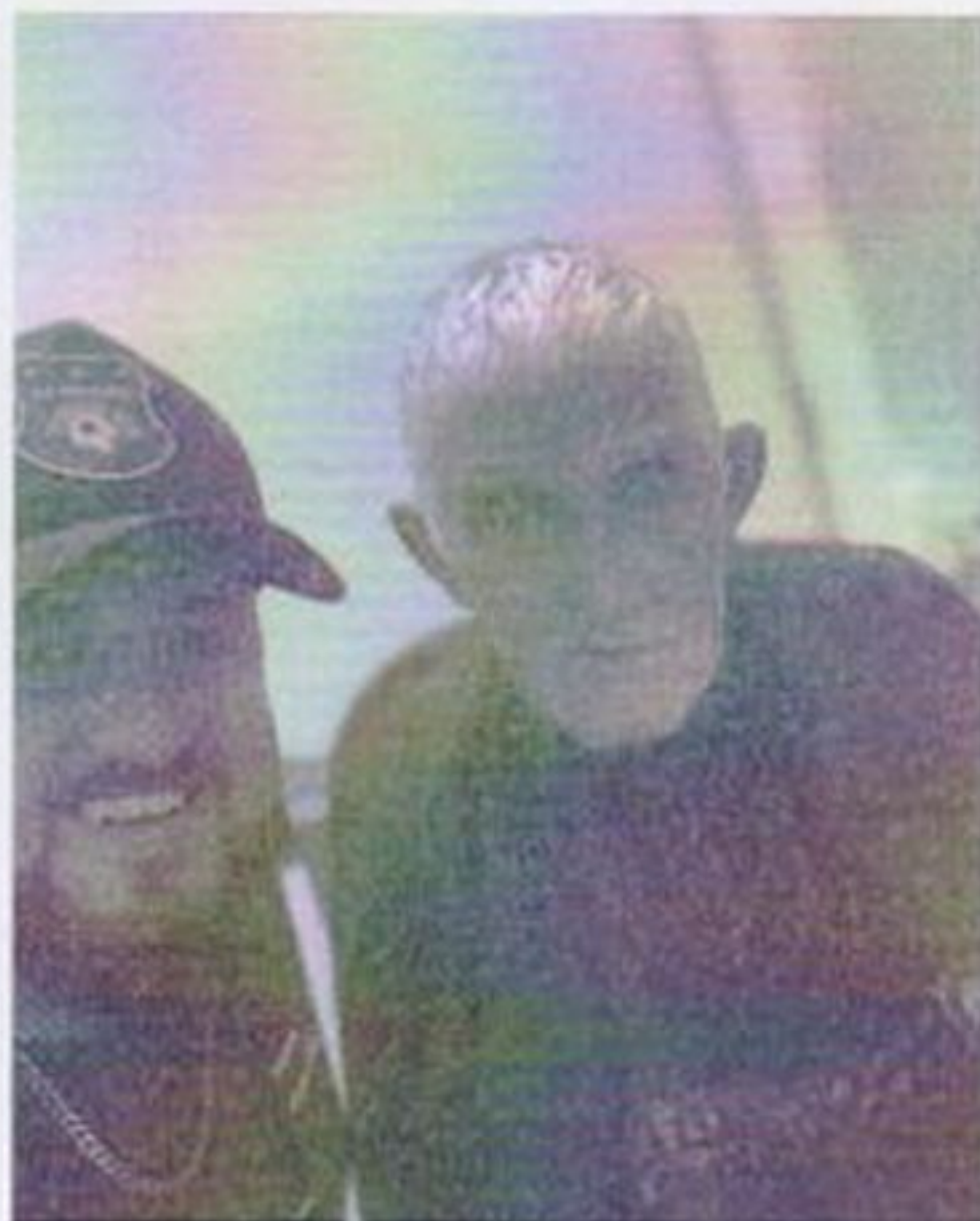
Dia de corta de cabelo