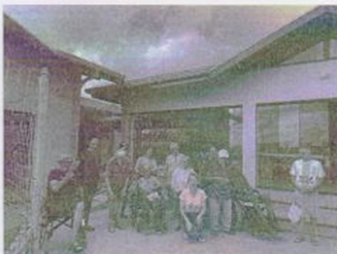
Passeio fazendo Gobbo