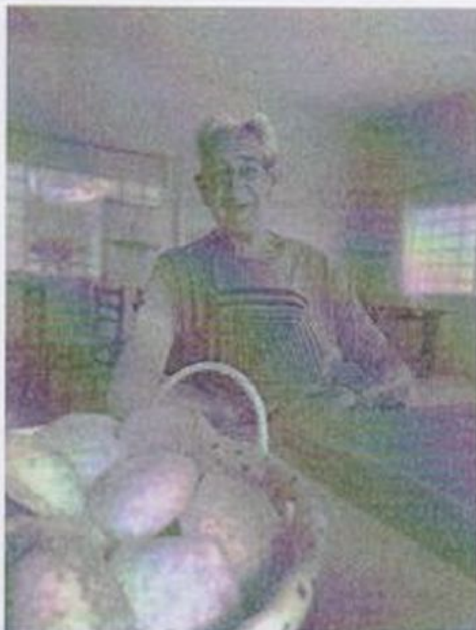
Café da manhã especial Novembro azul