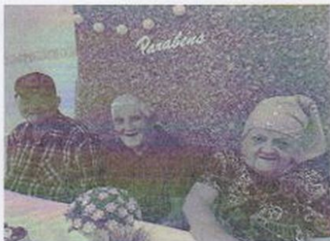
Comemoração aniversariantes do mês