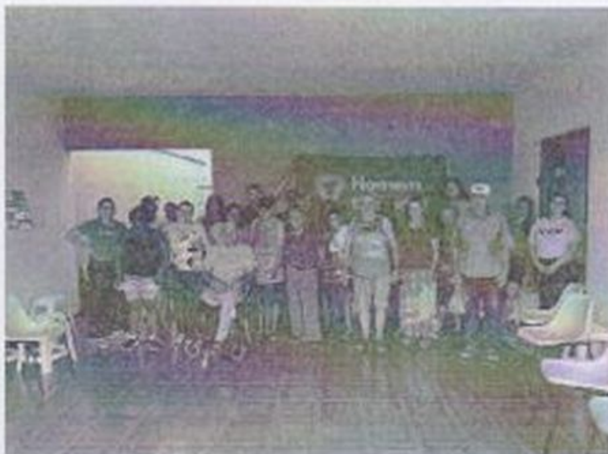
Palestra CRAS Vila

CEBAS nº 71000.070949 – Lei de Utilidade Pública Municipal nº 578/81 de 11 de março de 1981. Utilidade Pública Estadual, Decreto nº 47.480 de 19/12/02 – CRCE 0659/2012