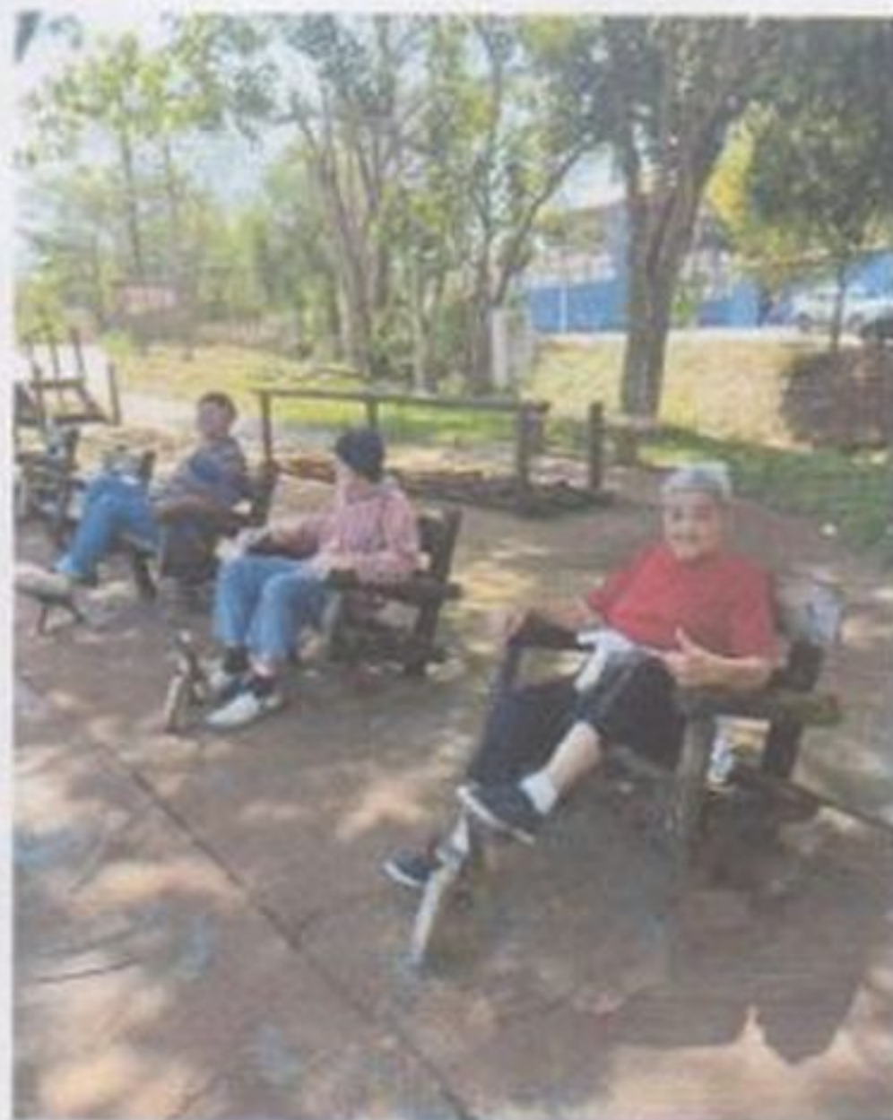
Caminhada ao ar livre

CEBAS nº 71000.070949 – Lei de Utilidade Pública Municipal nº 578/81 de 11 de março de 1981. Utilidade Pública Estadual, Decreto nº 47.480 de 19/12/02 – CRCE 0659/2012