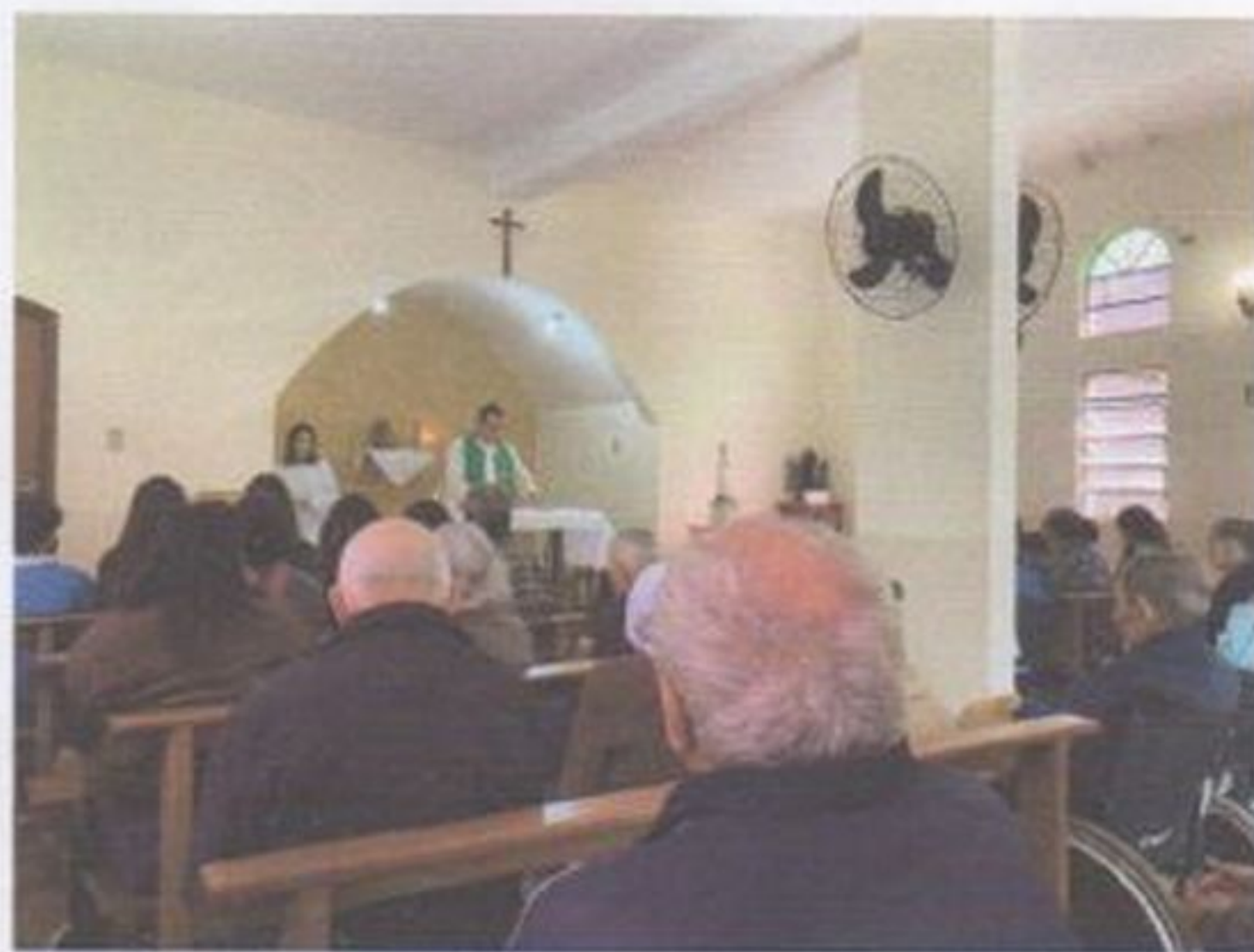
Missa com a comunidade