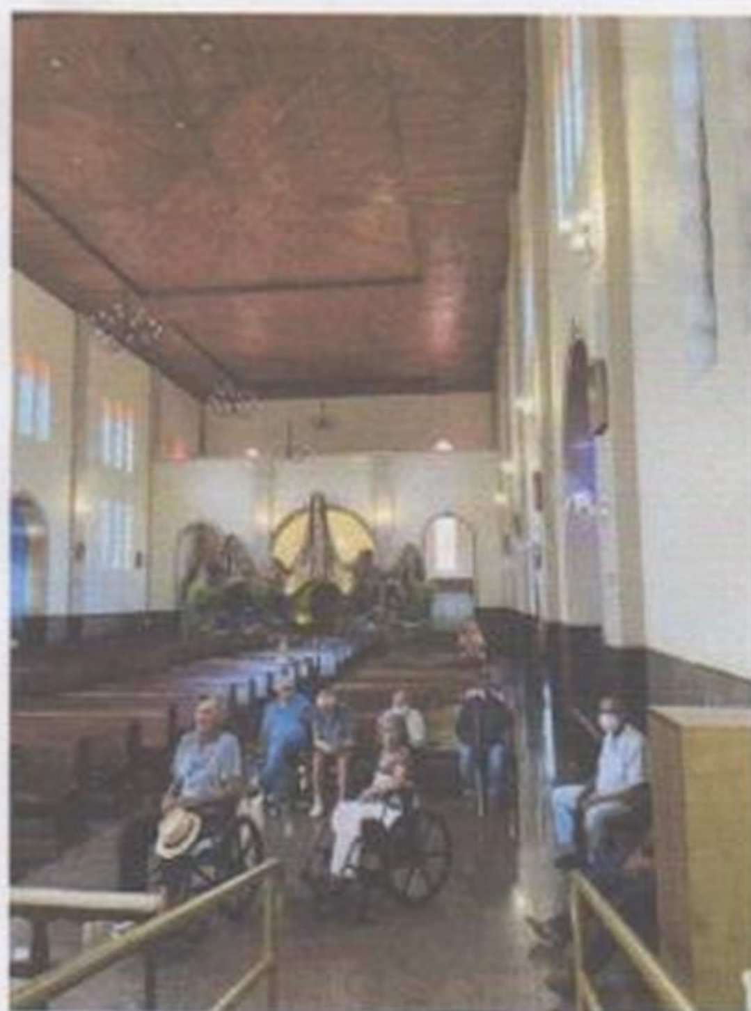
Visita na matriz