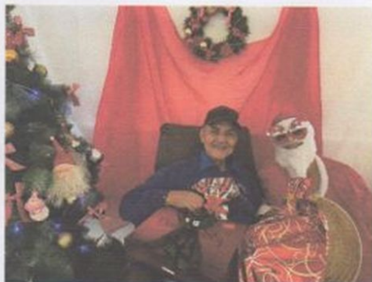
Entrega dos Presentes “ Cartinhas de Natal”

CEBAS nº 71000.070949 – Lei de Utilidade Pública Municipal nº 578/81 de 11 de março de 1981. Utilidade Pública Estadual, Decreto nº 47.480 de 19/12/02 – CRCE 0659/2012