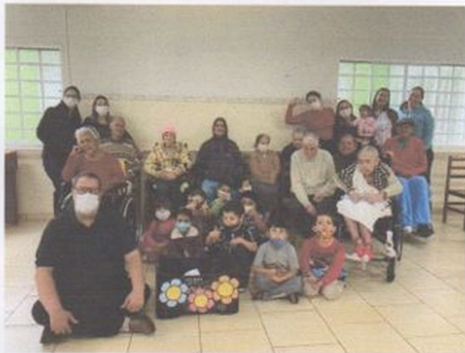
Visita de alunos e professores

CEBAS nº 71000.070949 – Lei de Utilidade Pública Municipal nº 578/81 de 11 de março de 1981. Utilidade Pública Estadual, Decreto nº 47.480 de 19/12/02 – CRCE 0659/2012