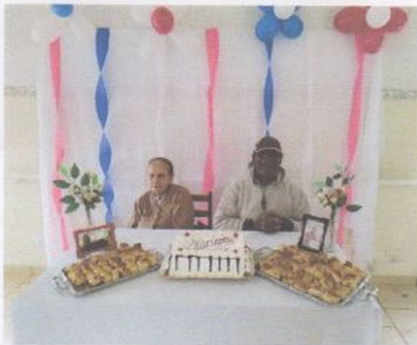
Comemoração dos aniversariantes do mês

11 Segue fotos de algumas atividades realizadas com idosos durante o ano de 2022.