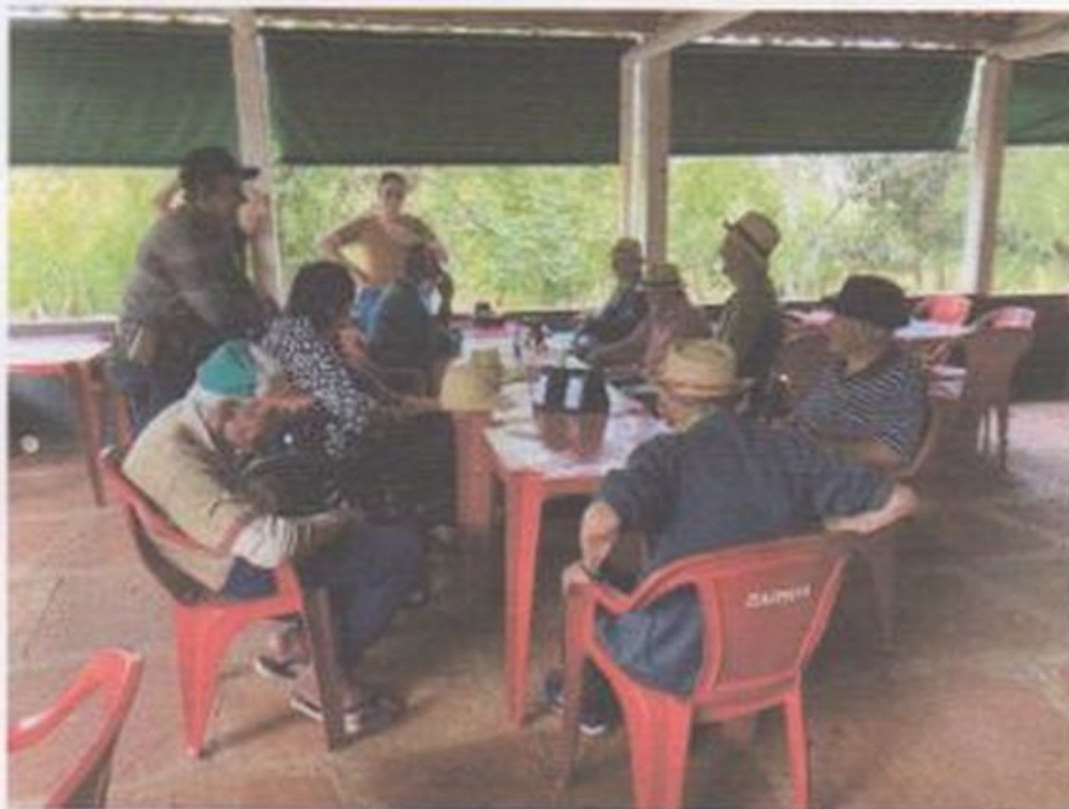
Passeio no pesqueiro

CEBAS nº 71000.070949 – Lei de Utilidade Pública Municipal nº 578/81 de 11 de março de 1981. Utilidade Pública Estadual, Decreto nº 47.480 de 19/12/02 – CRCE 0659/2012