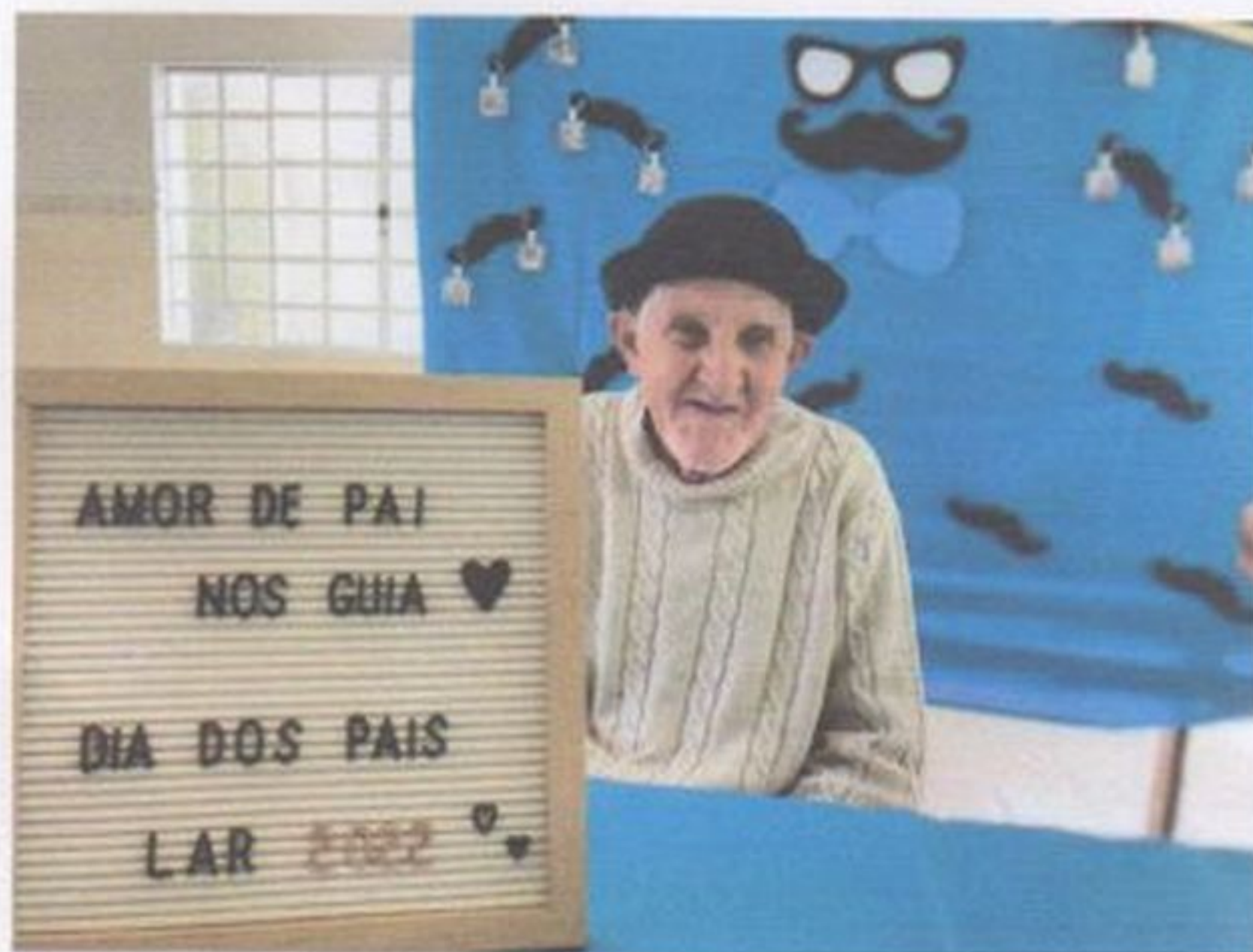
Comemoração dia dos pais

CEBAS nº 71000.070949 – Lei de Utilidade Pública Municipal nº 578/81 de 11 de março de 1981. Utilidade Pública Estadual, Decreto nº 47.480 de 19/12/02 – CRCE 0659/2012