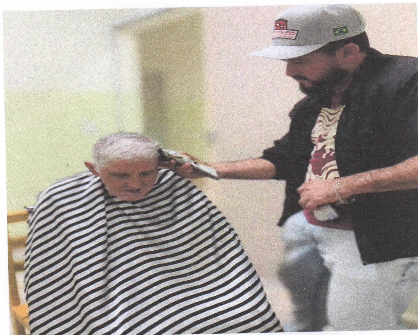
Dias de cortes de cabelo

CEBAS nº 71000.070949 – Lei de Utilidade Pública Municipal nº 578/81 de 11 de março de 1981. Utilidade Pública Estadual, Decreto nº 47.480 de 19/12/02 – CRCE 0659/2012