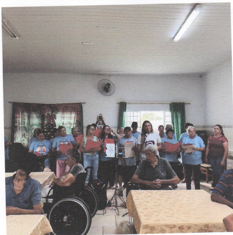
Visita de grupos da comunidade