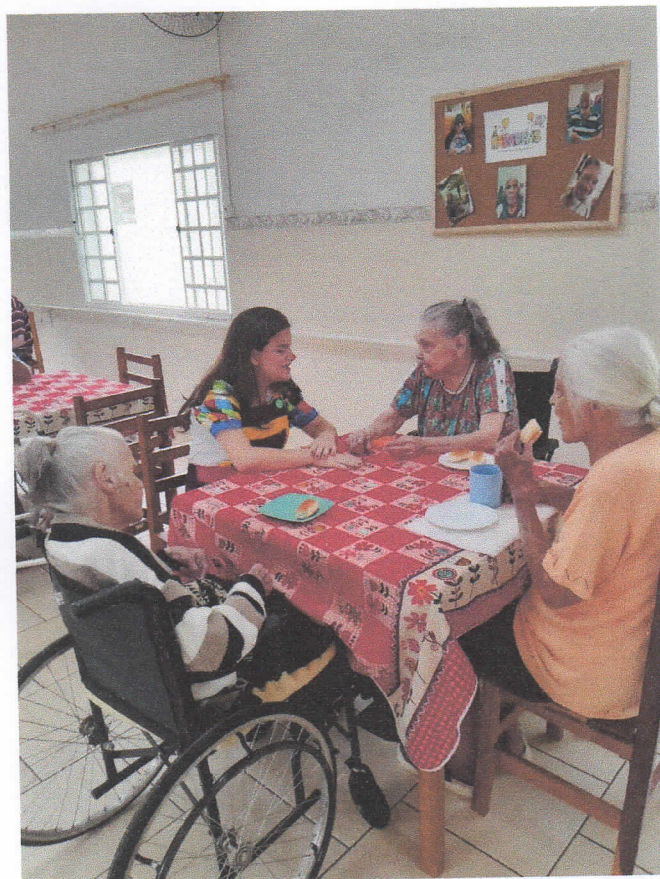
Visita do Grupo Mania de Alegria

CEBAS nº 71000.070949 – Lei de Utilidade Pública Municipal nº 578/81 de 11 de março de 1981. Utilidade Pública Estadual, Decreto nº 47.480 de 19/12/02 – CRCE 0659/2012