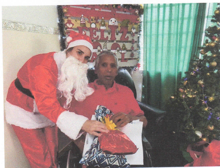
Projeto presentes de Natal