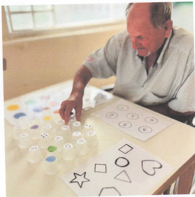
Oficinas e atividades

CEBAS nº 71000.070949 – Lei de Utilidade Pública Municipal nº 578/81 de 11 de março de 1981. Utilidade Pública Estadual, Decreto nº 47.480 de 19/12/02 – CRCE 0659/2012